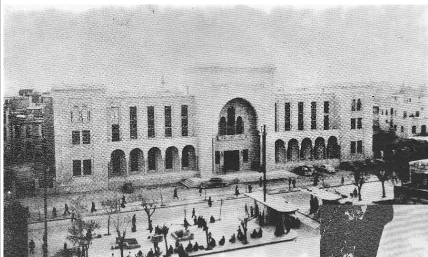
Soudní budova v centru Damašku— fotografie z roku 1902