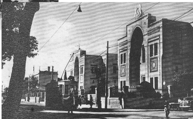
Budova parlamentu — fotografie z roku 1949