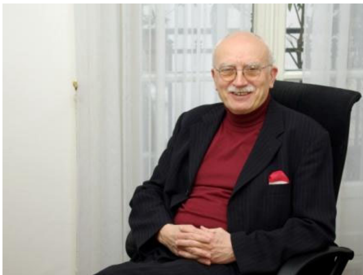
Karel Dyba velvyslanec a stálý představitel ČR při OECD