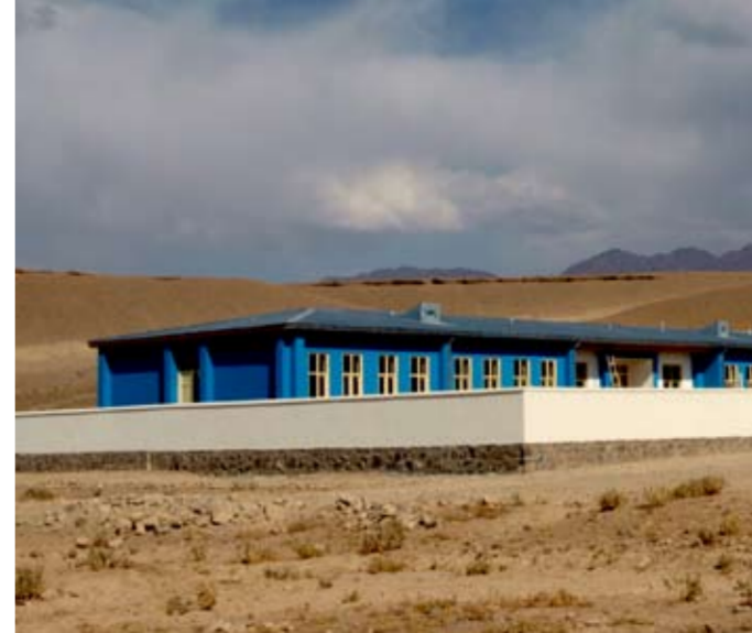
▲ ŽENSKÁ PRÁVA. V údolí Chuši se dívky musejí učit v soukromých domech či mešitách. Více než 600 z nich od roku 2009 navštěvuje dvě zcela nové školy postavené českým PRT. Podpora žen je průřezovým tématem projektů českého PRT.