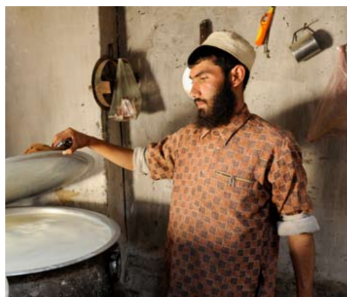
▲ ZEMĚDĚLSTVÍ. Mlékařství je zdroj obživy pro tisíce lidí v celém Lógaru. Český PRT pracuje na rekonstrukci sběru mléka v provincii: vyšší kvalita mléka znamená i vyšší výnosy pro zemědělce.