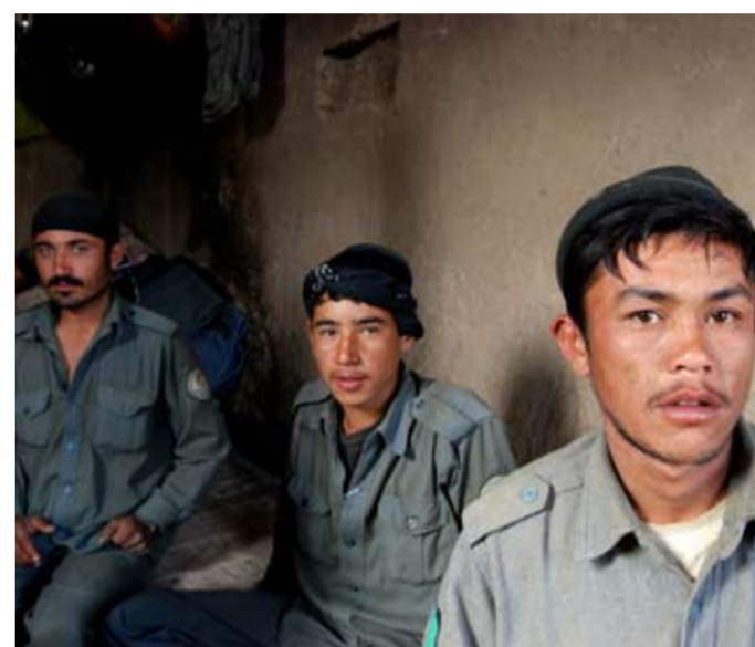
▲ PODPORA ANA A ANP. Posilování bezpečnosti v Lógaru je jednou z priorit českého rekonstrukčního týmu. Podpora projektů v této oblasti vychází z předpokladu, že pro rozvoj v dalších oblastech je bezpečné prostředí zcela nezbytné.