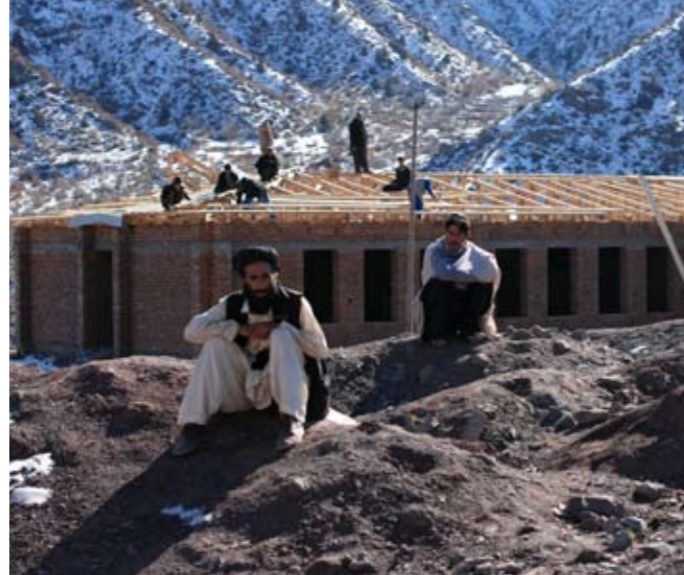
▲ ŠKOLSTVÍ. Poté, co bude dokončena stavba střední školy v distriktu Azra, opraví PRT i její starou budovu. PRT pomáhá afghánské vládě zajišťovat pro obyvatele základní služby: přístup ke vzdělání, zdravotnické péči či kvalitní infrastrukturu. Všechny rozvojové projekty, které PRT realizuje, jsou po svém dokončení afghánské vládě předány.