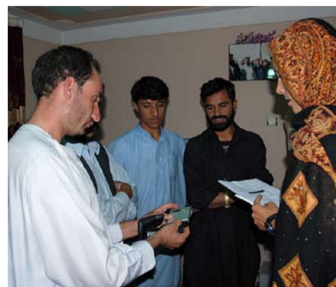
▲ MÉDIA. Afghánská média se ještě stále potýkají s nedostatkem finančních prostředků i kvalifikovaných lidí. Český PRT dodal technické vybavení pro dvě lógarské rozhlasové stanice a podpořil školení pro 16 novinářů. Další tři absolvovali stáž ve stanic Svobodná Evropa v Praze.