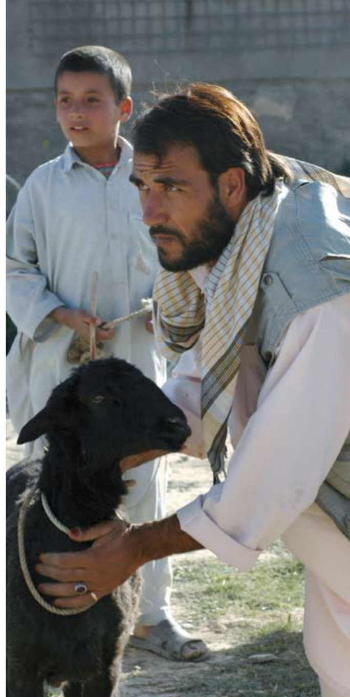
▲ VETERINÁRNÍ MEDICÍNA. Součástí podpory lógarského zemědělství jsou i projekty v oblasti veterinární medicíny. Patří mezi ně školení pro soukromé i státní veterináře, informační kampaně o nebezpečných chorobách, či dodávky vakcín proti žlutence.