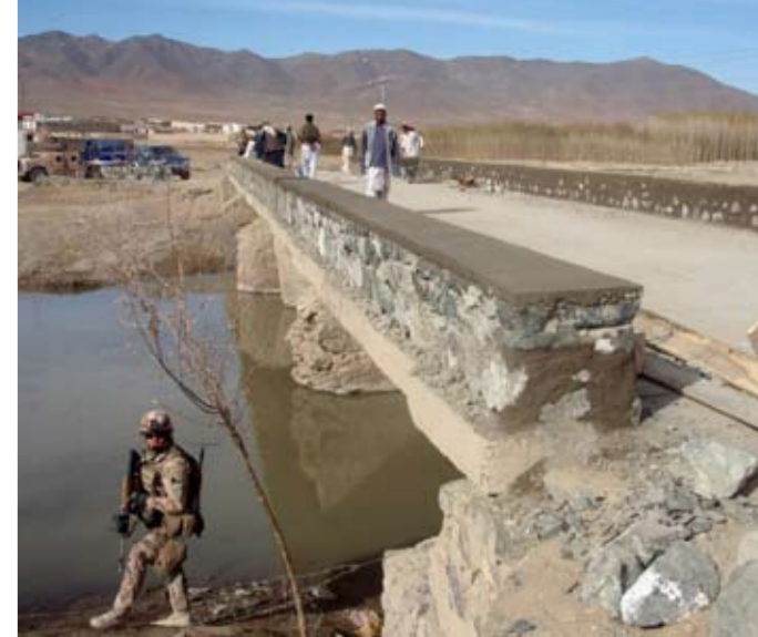
▲ ROZVOJ INFRASTRUKTURY. Obnova infrastruktury je pro afghánskou vládu kvůli vysokým nákladům jednou z největších výzev současnosti. Český rekonstrukční tým provedl v Lógaru průzkum pro stavbu 70 kilometrů silnic. V roce 2009 také financoval rekonstrukce 11 a stavby 3 nových mostů.