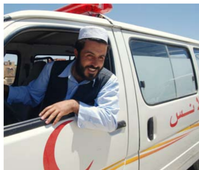
▲ ZDRAVOTNICTVÍ. Systém zdravotní péče je v Afghánistánu postížen dlouhodobými ozbrojenými konflikty. Vedle nedostatečné kapacity zdravotnických zařízení jsou omezené i možnosti přepravy pacientů. Není výjimkou, že lidé umírají, protože se včas nedostali do nemocnice či k lékaři. Český PRT mimo jiné opravil 2 budovy nemocnic a dodal sedm vozů na převoz pacientů.