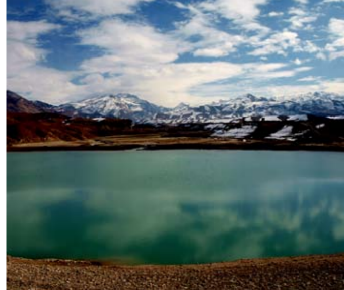
▲ VODA. Na deset měsíců získalo díky projektu opravy přehrady Surchab práci 145 lidí z Lógaru. Vytváření pracovních míst pro obyvatele z Lógaru je jednou ze zásad práce českého týmu. PRT postavil či opravil pět jezů, kanálů a ochranných zdí.