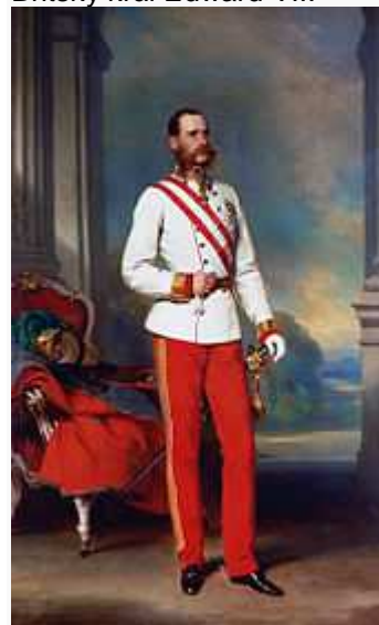
František Josef I.

Mariánské Lázně pravidelně navštěvovalo mnoho významných hostů, kteří se zasloužili o jejich věhlas ve světě.