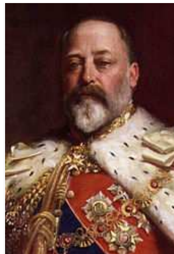
Britský král Edward VII.