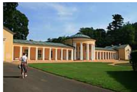
Kolonáda Ferdinandova pramene

Místo, kde dnes leží druhé největší lázeňské město, Mariánské Lázně, bylo v dávných dobách plné bažin a zcela pusté. Mocný šlechtic Hroznata založil v roce 1197 klášter v Teplé, pod jehož