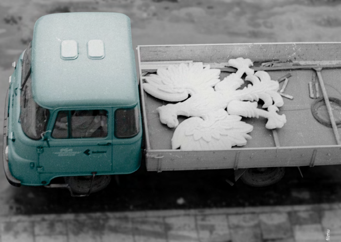
kadry z filmu