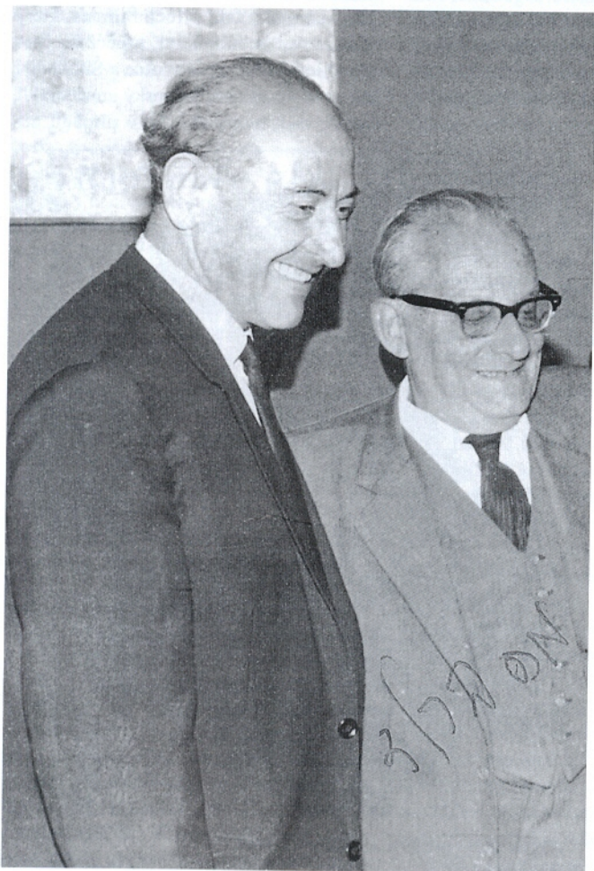
Ch. Rozen s Maxem Brodem, Izrael 1964.

a začal se živit svou profesí. Tehdy bylo nástrojařství v Izraeli velmi hledané. Dobře se platilo. To řemeslo mi taky dobře posloužilo, když jsme pro Haganu ilegálně vyráběli zbraně.