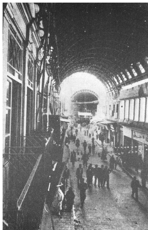
Souq Al Hamidiya - počátek 20. stol