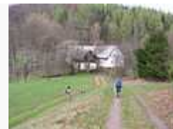
Cesta od hradu, v pozadí chalupa prezidenta Václava Havla