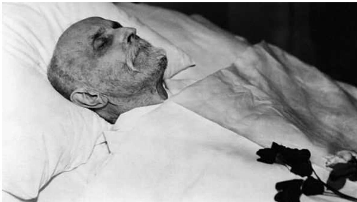
Tomáš Garrigue Masaryk zemřel 14. září 1937 v Lánech, jeho pohřeb byl zřejmě nejmasovější spontánní trýznou.

Pohřby českých prezidentů jsou i odrazem pohnutých dějin národa. Zatímco první prezident T. G. Masaryk se dočkal státního pohřbu se všemi poctami a desetitisíčovými zástupy, protektorátnímu prezidentovi Emilu Háchovi nebylo vystaveno ani smuteční oznámení. Za totality pak byli Češi svědky zinscenovaných pohřbů, za účasti armád a tisíců lidí. Ale ani ne všem komunistickým prezidentům byly vypraveny státní pohřby.