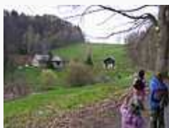
Horní část vsi při pohledu ze silnice u Havlovy chalupy.