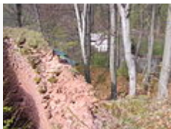
Ves při pohledu z hradu Břečtejna.