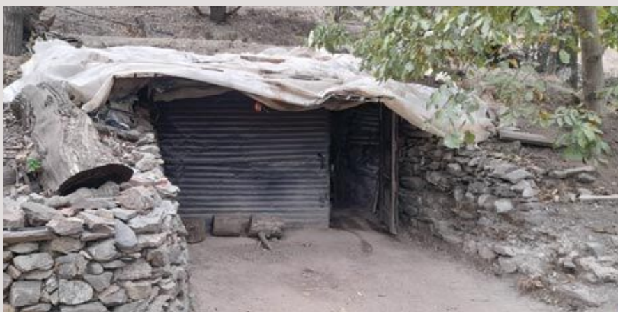
Terénní stanice strážců v Národním parku Chréa. Svůj účel plní.

Správa Národního parku Šumava losec.stemberk@npsumava.cz