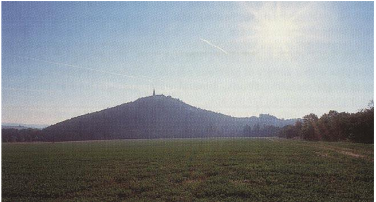
Zelena Hora/Πράσινο Όρος

Η οικονομία του ανατολικού τμήματος της περιφέρειας επηρεάζεται από την συγκέντρωση της βιομηχανίας στη γειτονική πόλη, Μπρνο. Το βορειοδυτικό τμήμα της αποτελεί τον πόλο έλξης της Πράγας. Η στρατηγική θέση της περιφέρειας έχει προσελκύσει πολυάριθμες ξένες επενδύσεις, που εγκαθιστούν στην περιοχή όχι μόνο την γραμμή παραγωγής αλλά και τα τμήματα έρευνας και ανάπτυξης.