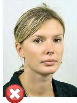
Pohled přes rameno Portrait style

Oblíčeť musí být ve středu pohledu kamery (fotoaparátu). Není povolen pohled přes rameno nebo úklon. Fotografie musí zobrazit obě strany obličeje souměrně. Pro další kontrolu použijte příloženou šablonu. / Face must be in the centre. Portrait style and tilted positions are not acceptable. The photograph must show both sides of the face evenly. Please use the template for further check.