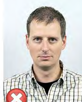
Příliš vzadu Too far away