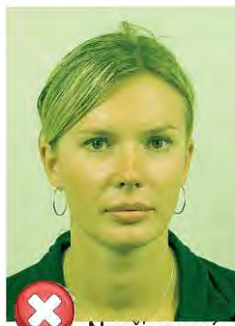
Nepřirozené barvy pokožky Unnatural skin tones