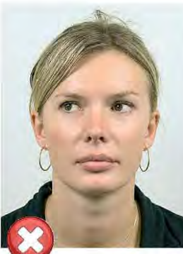
Pohled mimo Looking away

Oči musí být otevřené a celé viditelné. Nesmí být zakryty vlasy nebo obroučkami brýlí. / Eyes open and clearly visible, no hair across the eyes.