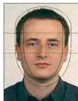
Umístění obličeje Positioning of face