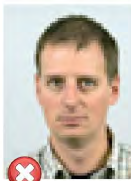
Nízké rozlišení Pixelated