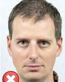
Příliš blízko Too close