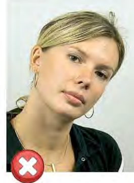
Natočené oči a hlava Eyes/head tilted