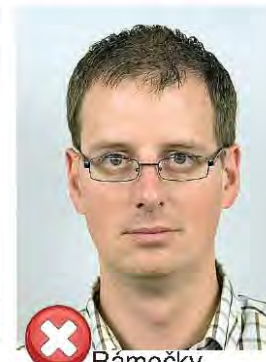
Rámečky překrývají oči Frames covering eyes