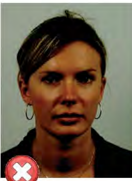
Příliš tmavé Too dark

Osvětlení žadatele musí být stejné na celé ploše fotografie bez reflexních ploch nebo stínů ve tváři. / Balanced lighting, no shadows or flash reflections on face.