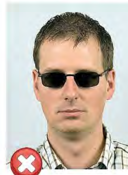
Tmavá skla brýlí Dark glasses