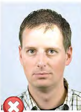
Odlesky ve tváři Flash reflection