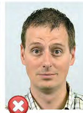
Zvednuté obočí Raised eyebrows