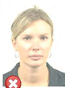
Příliš světlé Too light