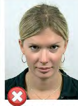
Úklon hlavy Pitch