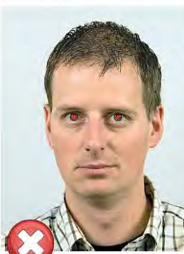
Červené oči Red eyes