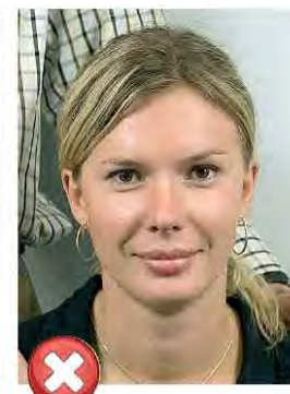
Další osoby Another person