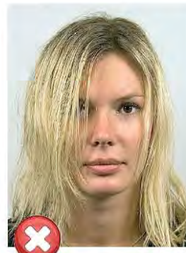
Vlasy přes oči Hair across eyes