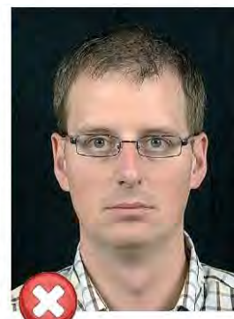
Tmavé pozadí Dark background