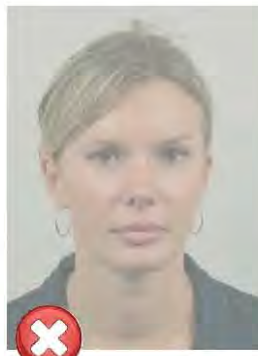
Nízký kontrast Low contrast