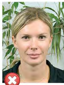
Rušivé pozadí Busy background

Fotografovaná osoba musí být zobrazena samostatně. Např. u dětí není povolena asistence další osoby. Stejně tak nesmí být zobrazeny další předměty (židle, hračky). / The photographed person must be shown alone with clear background (other persons or items must not be in the picture).