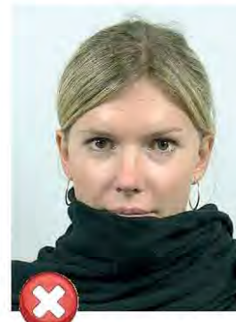
Zakrytý obličej Face covered