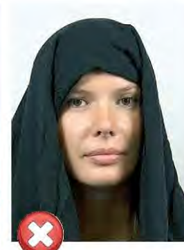
Stíny přes tvář Shadows across face