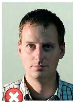
Stíny ve tváři Shadows across face