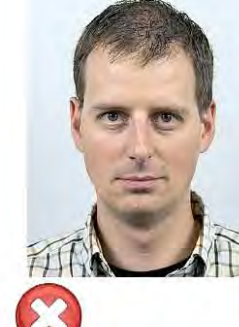
Příliš malá Too small