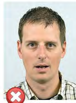
Otevřená ústa Open mouth