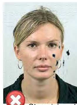
Stopy inkoustu / přehnutá Ink marked / creased