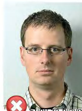
Stíny za hlavou Shadows behind head