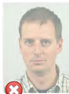
Vybledlý tisk Washed out colour