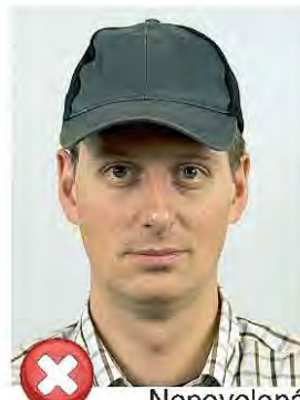
Nepovolená pokrývka hlavy Wearing a hat

Veškeré požadované charakteristiky obličeje musí být viditelné. Tzn. obě strany obličeje a oblast od vrcholu čela po bradu. / Facial features from bottom of the chin to top of forehead and both sides of the face must be clearly shown.