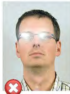
Odlesky od skel brýlí Flash reflections

Je důležité se vyhnout použití extrémně silných rámečků. / Avoid heavy frames.