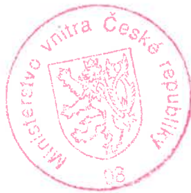
Mgr. Richard Kordecký ministrský rada

Proti tomuto usnesení lze podat odvolání ke Komisi pro rozhodování ve věcech pobytu cizinců, a to dle ustanovení § 81 odst. 1 správního řádu, ve spojení s ustanovením § 170b odst. 1 zákona č. 326/1999 Sb. Podle ustanovení § 86 odst. 1 správního řádu se odvolání podává u odboru azylové a migrační politiky Ministerstva vnitra České republiky, a to dle ustanovení § 83 odst. 1 citovaného právního předpisu, ve lhůtě do 15 dnů ode dne oznámení tohoto usnesení. Podle ustanovení § 76 odst. 5 správního řádu nemá odvolání proti tomuto usnesení odkladný účinek.