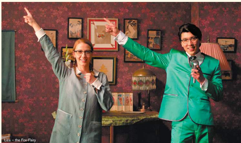
Liza – the Fox-Fairy