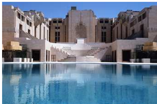
Z hotelu Sheraton v Damašku

Zastupitelský úřad podepsal s vedením hotelu Sheraton v Damašku smlouvu, podle které je hostům zastupitelského úřadu (včetně podnikatelů) garantována cena 120 EUR za noc navýšená o aktuálně 12,5 % daň. Celkově tak částka za ubytování dosáhne 134 EUR včetně snídaně. Vedením hotelu bylo také přislíbeno, že v případě volných kapacit bude host ambasády ubytován v pokoji vyšší kategorie.