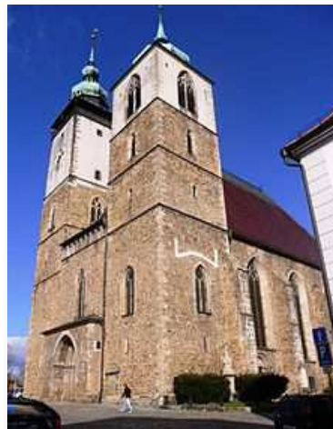
Kostel sv. Jakuba od JZ