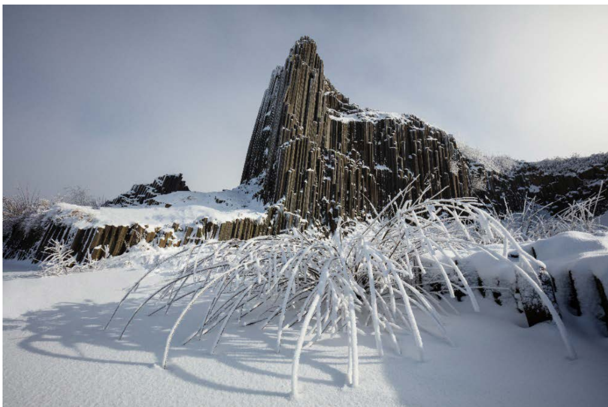
Panská skála, Lužické hory