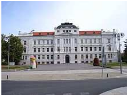
Tábor-budova Zemědělské školy (z r. 1903), za ní až k Jordánu se rozprostírá botanická zahrada

Zahrada byla založena roku 1866 a je druhou nejstarší botanickou zahradou v České republice. Patří k Střední zemědělské škole, která měla mezi léty 1900 až 1918 status vysoké školy. Tou dobou také zaznamenala botanická zahrada největší rozkvět. Zahrada zásobuje svými semeny své okolí od roku 1906. Nyní zasílá semena do více než 400 míst po celém světě a na přibližně 100 míst po celé České republice.