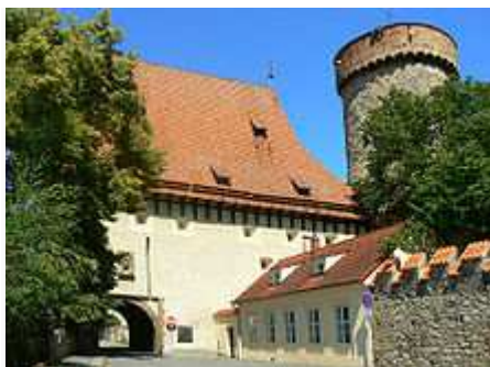
Kotnov a Bechyňská brána