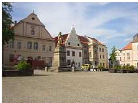
Pomník Jana Žižky z let 1877 až 1884 přehlíží stejnojmenné ústřední náměstí

Tábor byl založen na jaře roku 1420 husity a pojmenován podle hory Thabor u Nazaretu, v dnešním Izraeli. Podle biblické Knihy soudců přikázala prorokyně Debora izraelskému vůdci Barakovi: "Sám Hospodin, Bůh Izraele, ti přikazuje: táhni hned na horu Tábor a vezmi s sebou deset tisíc mužů..." (Sd 4,6 (Kral, ČEP)). Barak ji poslechl a z této hory pak drtivě porazil kanánské vojsko.