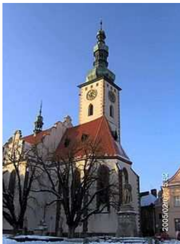
Děkaný kostel Proměnění Páně na hoře Tábor, Žižkovo náměstí (2005)