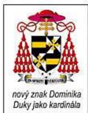
nový znak Dominika Duky jako kardinála

2 Bílá rocheta (volně liturgické roucho, které sahá po kolena zdobené krajkou. Pod rouchem tělo obepíná červený pás (cingulum)