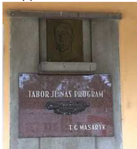
Deska na nádraží v Táboře připomíná návštěvu prezidenta T. G. Masaryka 21. 12. 1918