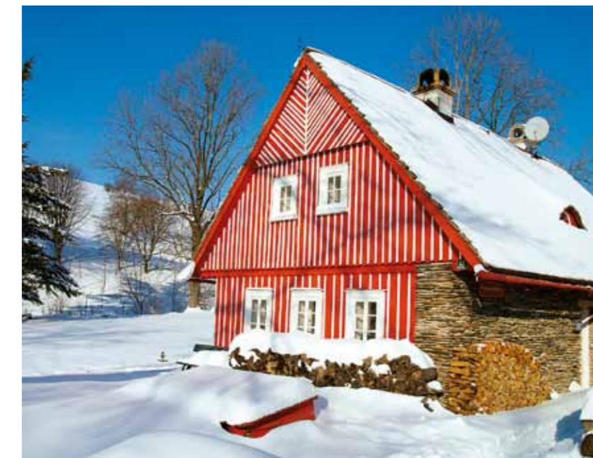
Chalé nos Montes Gigantes