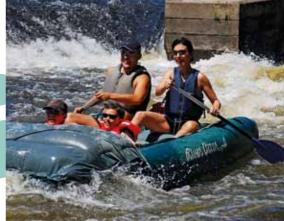
Praticantes de nautismo no rio de Moldava em Vyšší Brod