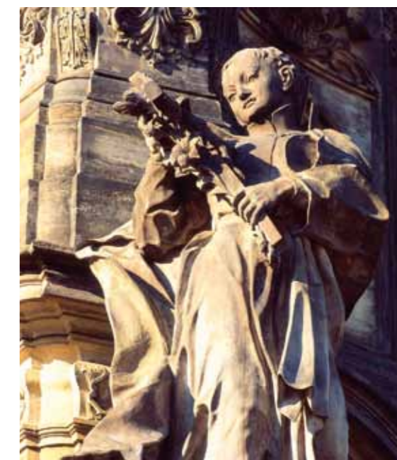
Detalhe da coluna da Santíssima Trindade em Olomouc