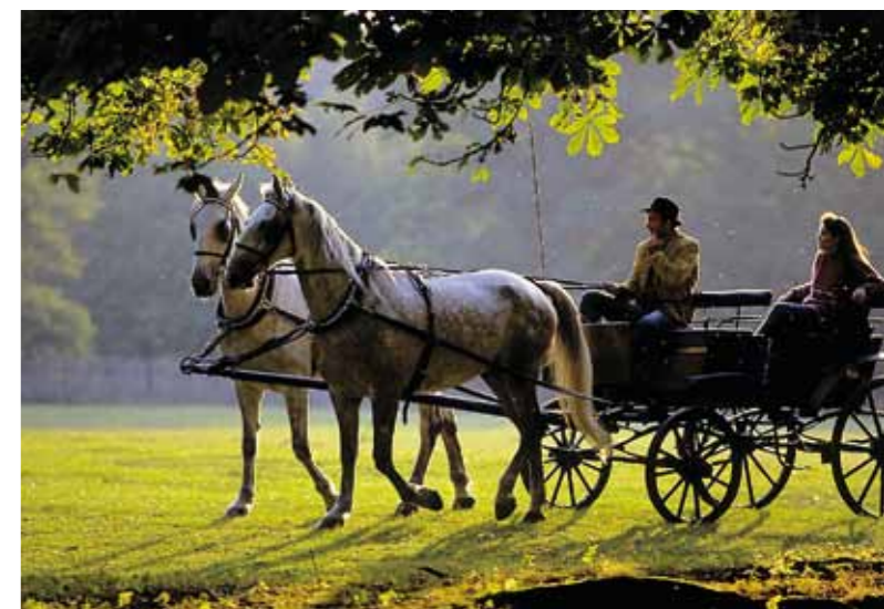
Passeio de coche