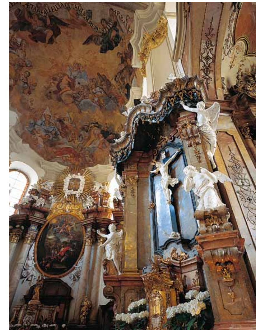
Interior da igreja em Olomouc