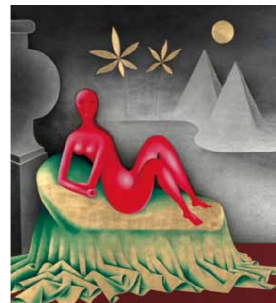
Galeria Nacional – Jan Zrzavý – Cleópatra

a Pinacoteca do Castelo de Praga, a Galeria Nacional ou o Museo Nacional, representam uma verdadeira raridade checa as centenas de museus da civilização e temáticos e de monumentos de notáveis personagens, dos quais orgulham-se devidamente os habitantes também das cidades e povoações mais pequenas.