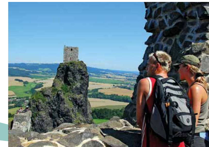
Vista sobre a paisagem do castelo de Trosky