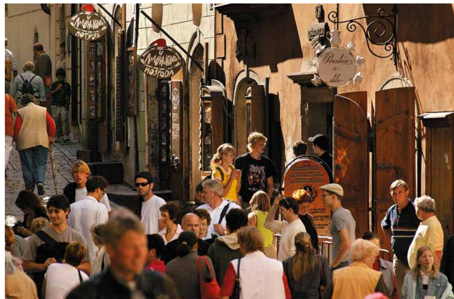
Rua Radniční em Český Krumlov