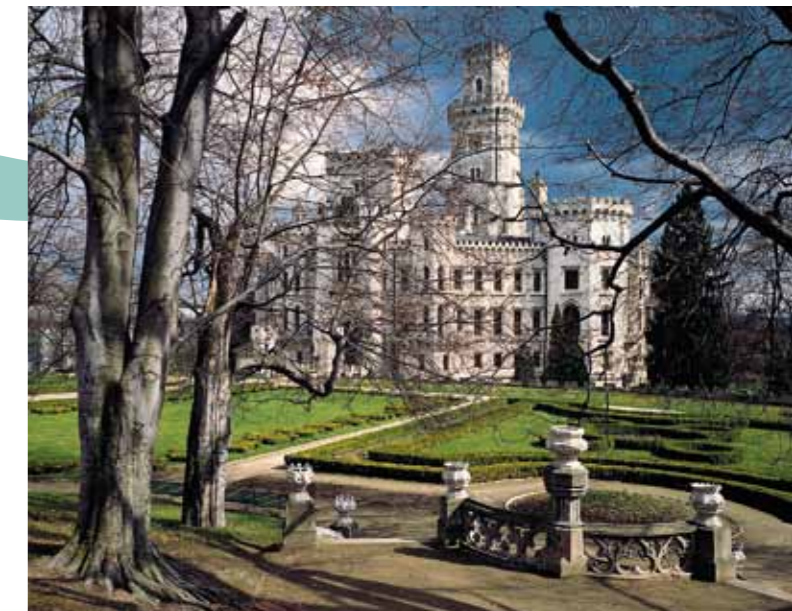
Palácio de Hluboká

Bezděz, Pernštejn, Loket, Kost, ou os palácios renascentistas de arcadas de Litomyšl, Velké Losiny, Telč, Jindřichův Hradec. Outros, sucessivamente remodelados ficando cada vez mais pomposos e lindos - tais como Český Krumlov, Vranov, Lednice, Valtice, Bouzov, representam um desfile do desenvolvimento dos estilos arquitectónicos assim como um manual claro da história que atravessou a Europa Central. Fazem parte dos tours de visita os interiores magníficos equipados com as colecções únicas e muitas vezes também jardins, parques e tapadas bonitas. Em muitos lugares realizam-se festas históricas, visitas nocturnas, representações teatrais ou concertos.