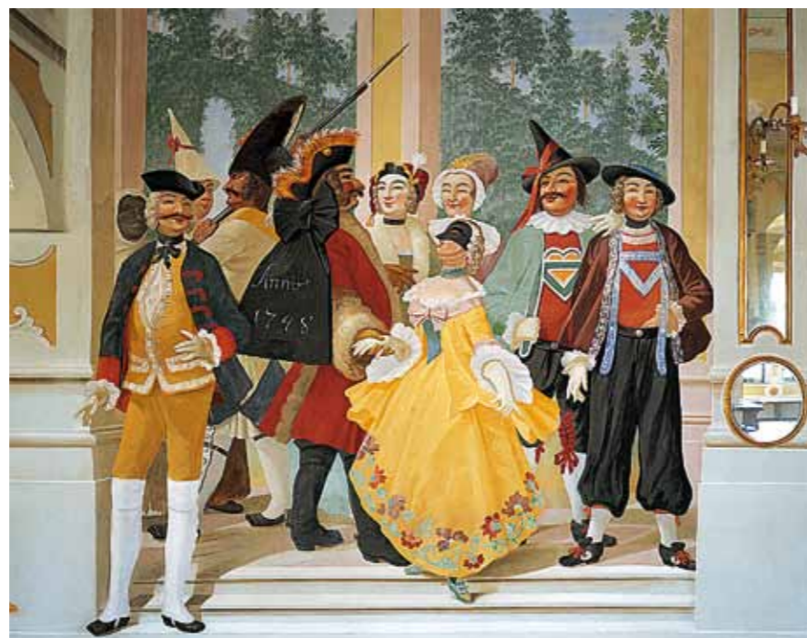
Decoração da Sala de Máscaras no palácio de Český Krumlov

Não somente os soberanos checos, mas também a nobreza nacional e estrangeira e com o tempo os burgueses cada vez mais influentes exibiam o seu poder e a sua riqueza. Em quarenta cidades checas conservaram-se intactos os centros históricos, protegidos hoje como reservas de património, podendo porém encontrar com certeza em cada cidade grande assim como pequena monumentos interessantes e bem mantidos e pérolas arquitectónicas peculiares. Às cidades mais atraentes pertence Český Krumlov, cidade gótico-renascentista única com estreitas ruelas medievais e o extenso