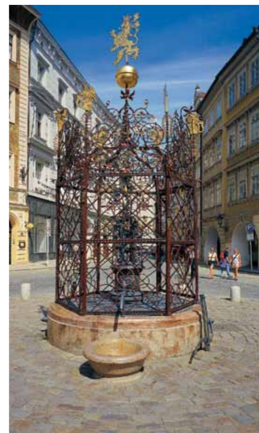
Chafariz na Praça Pequena

Nelahozeves – palácio renascentista com interiores únicos [ www.lobkowicevents.cz ]