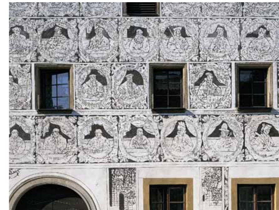
Detalhe da fachada da casa burguesa em Slavonice

castelo acima do rio (o segundo mais grande no país depois do Castelo de Praga), Kutná Hora, cidade régia que enriqueceu na Idade Média com a extracção de prata, as pérolas renascentistas sem par de Telč e Slavonice, as cidades arcebispaís de Olomouc e Kroměříž, a cidade vinícola de Znojmo ou Mikulov assim como o centro da Morávia do Sul – Brno.