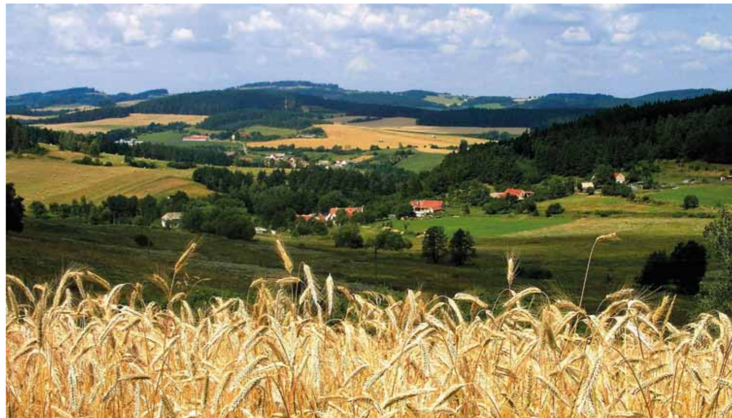
Paisagem de Šumava

Šumava – telhado verde da Europa