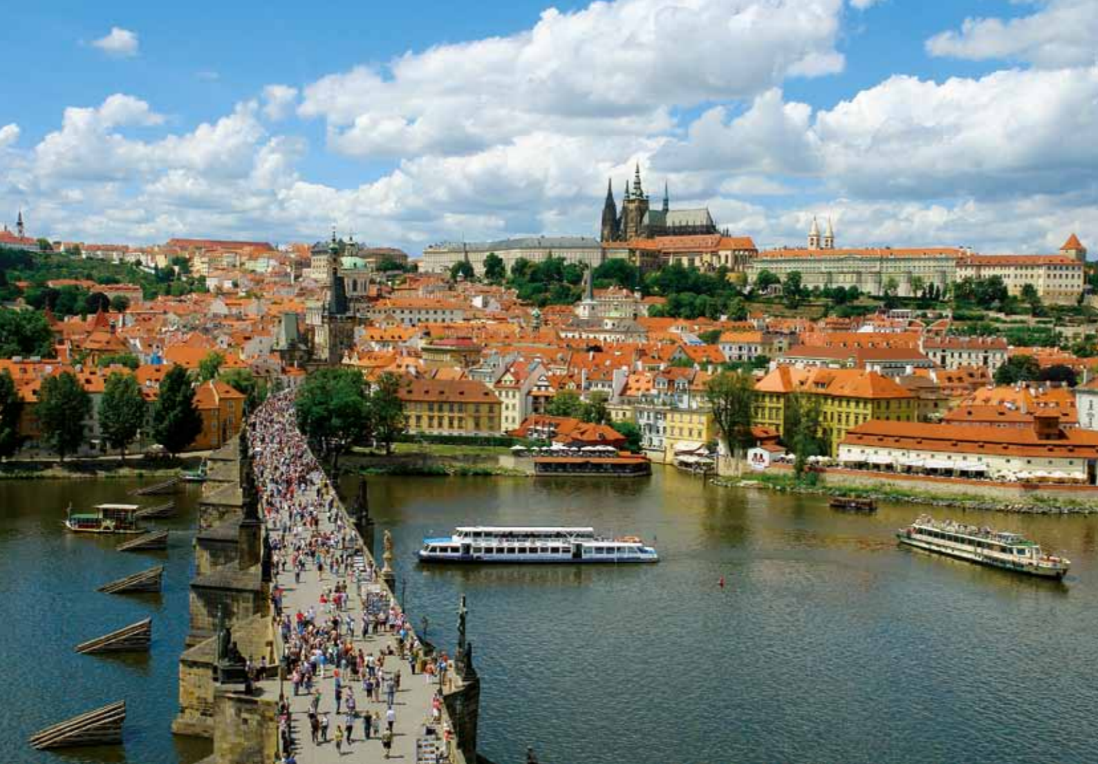
Panorama de Praga com a Ponte Carlos e Hradčany