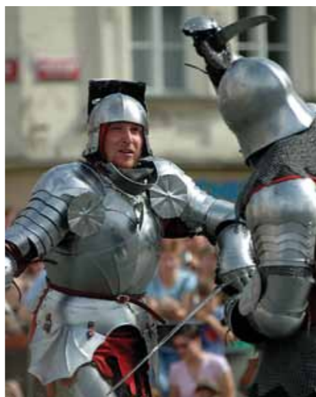
Duelo de cavaleiros

Uma quantidade surpreendente de quase de dois milhares de castelos, palácios, pequenas fortalezas assim como suas ruínas faz parte inseparável da paisagem checa. Os seus proprietários, ou o Estado ou as pessoas privadas – na sua maior parte os descendentes das notáveis famílias da nobreza, na temporada de verão (em alguns casos mesmo durante todo o ano) tornam acessíveis uns 200 deles à visita com a explicação erudita do guia. Alguns deles são amostras de primeira ordem da arquitectura de estilo puro – tais como por exemplo os castelos góticos de