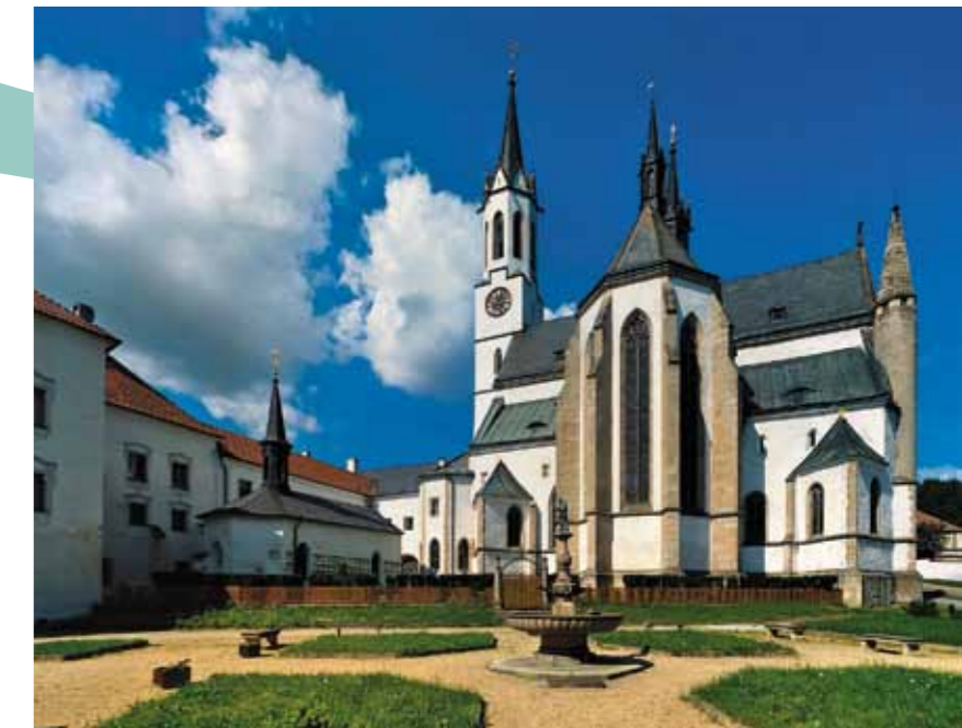
Convento em Vyšší Brod