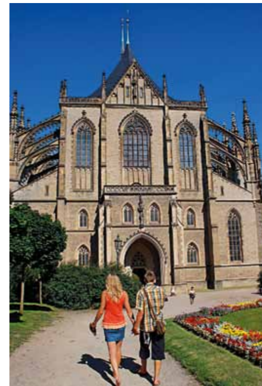
Igreja de Santa Bárbara em Kutná Hora

Igreja de São João Nepomuceno em Žďár nad Sázavou [ www.zamekzdar.cz ]