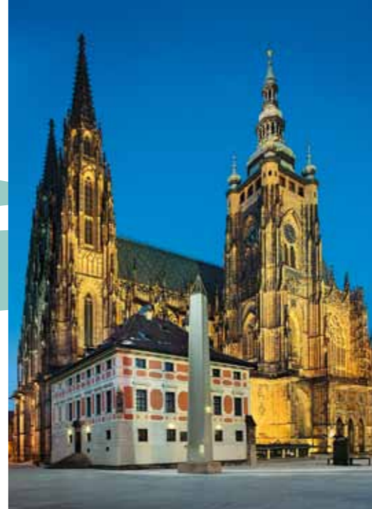
Catedral de São Vito

assim como artistas de todo o mundo. Uma especial atmosfera inspiradora de Praga fascina os estrangeiros desde os tempos romanos até hoje. Os bairros históricos mantiveram até hoje o maior encanto: a Cidade Velha única com a praça espaçosa onde cada hora o relógio medieval badala o tempo, com a universidade, com uma floresta de torres de igrejas assim como com os restos do vasto gueto judeu; o Pequeno Bairro nas encostas debaixo do Castelo de Praga – um entrançado de ruelas sinuosas e escadas, o bairro cheio de monumentos religiosos assim como de grandes palácios de nobreza e jardins refinados; Hradčany – o pitoresco bairro nas vizinhanças da sede impressionante dos soberanos checos.