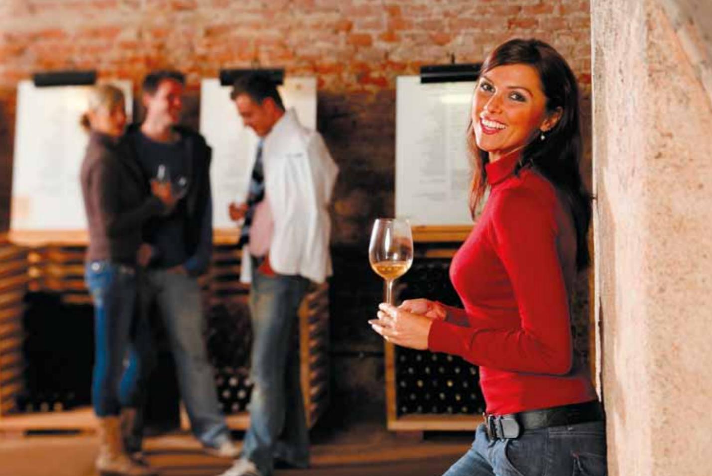
Salão de vinhos em Valtice