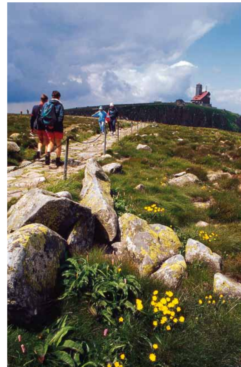
Montes Gigantes – Sněžné jámy