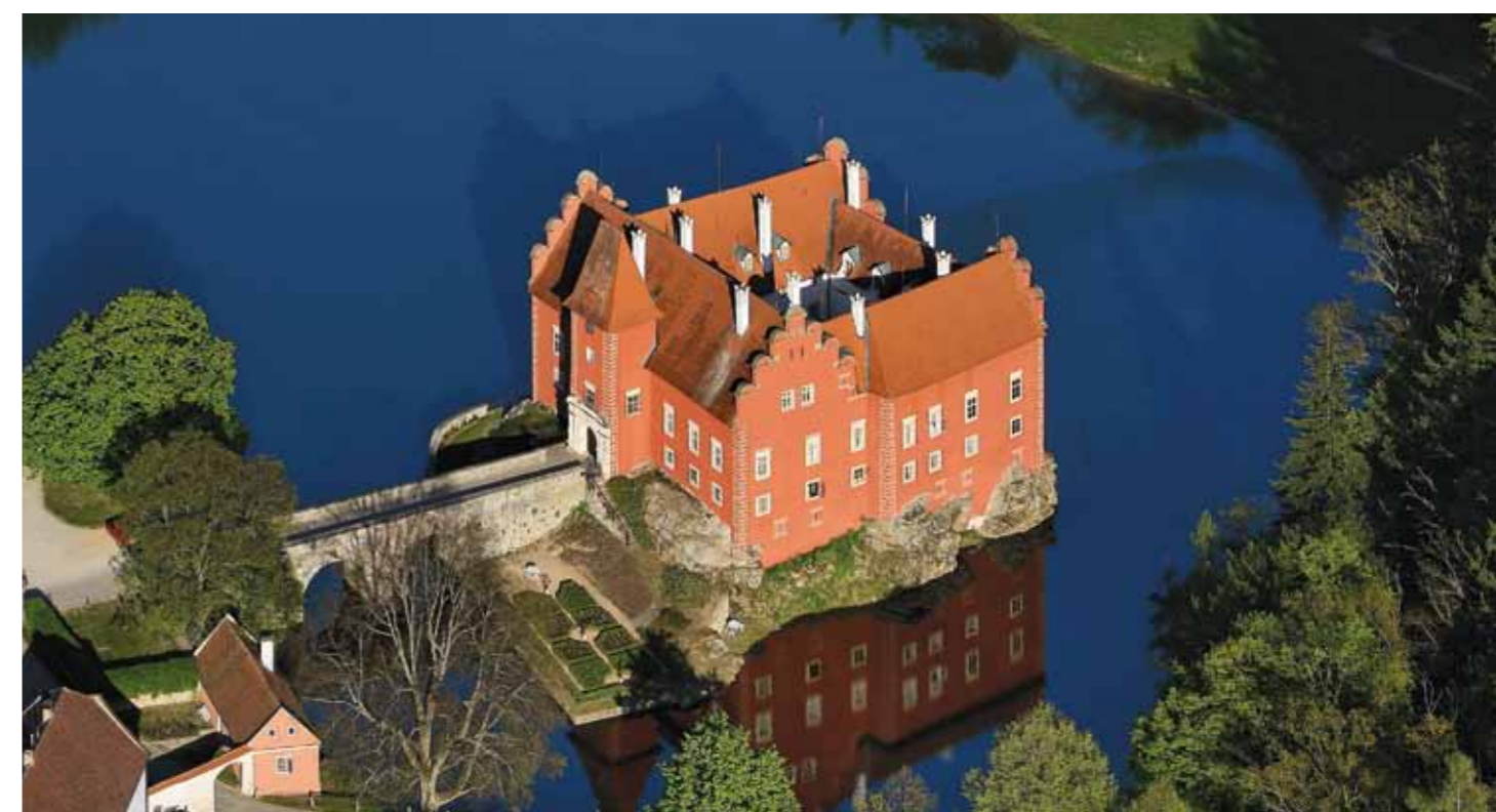
Palácio de Červená Lhota