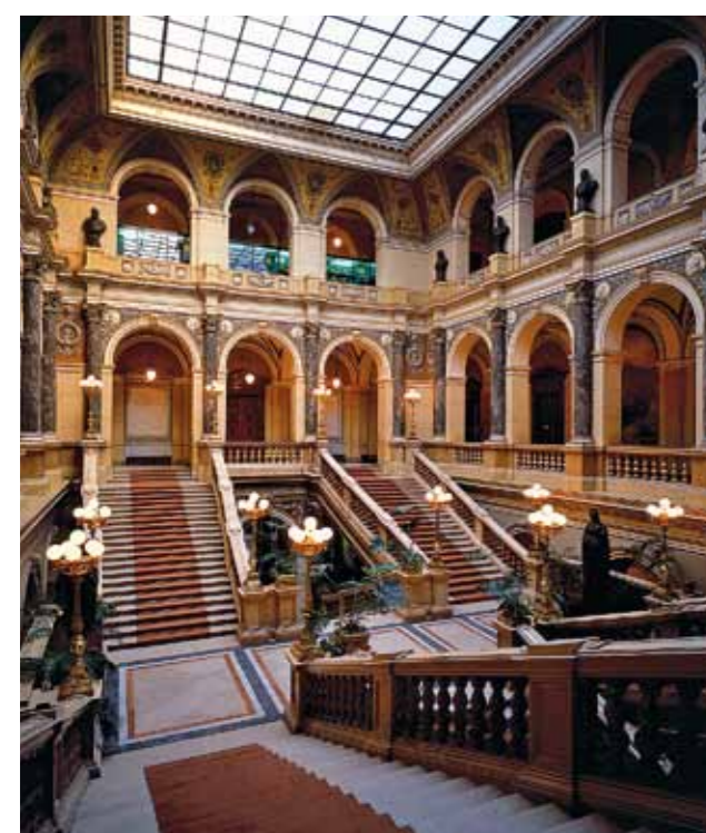
Interior do Museu Nacional