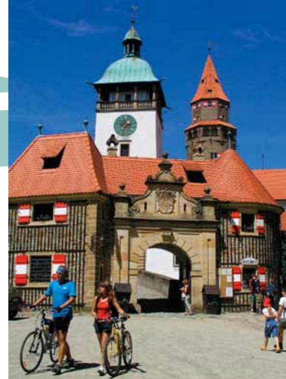
Castelo de Bouzov