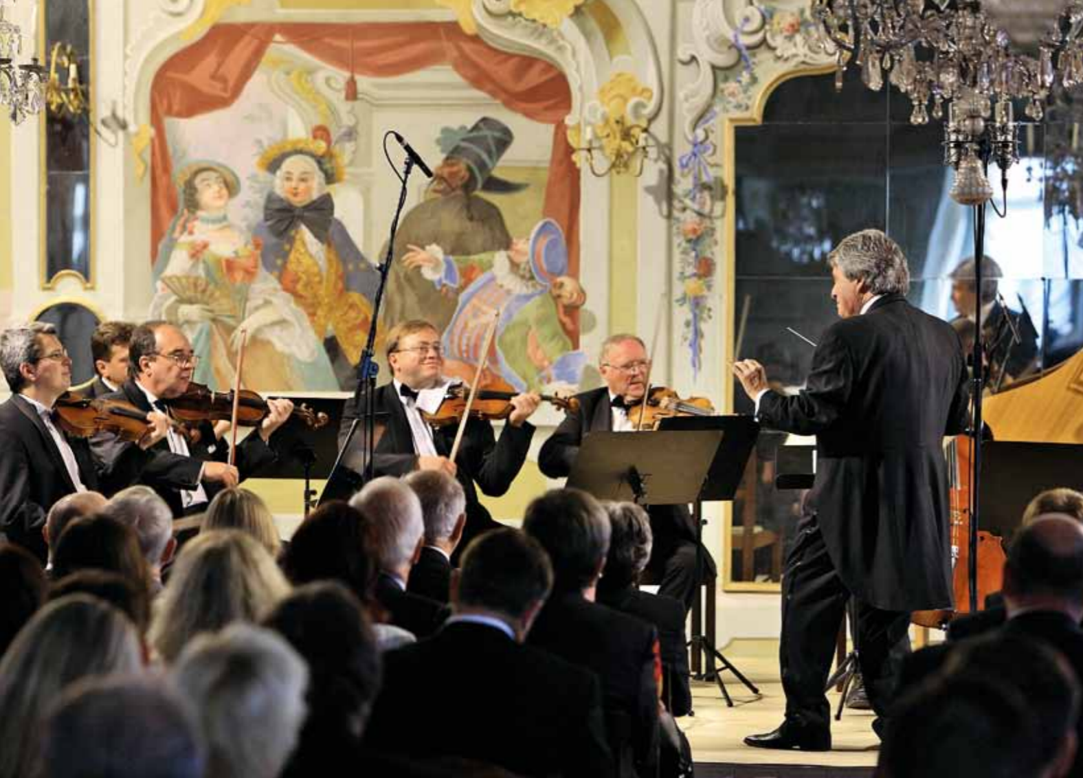
Festival Internacional de Música em Český Krumlov