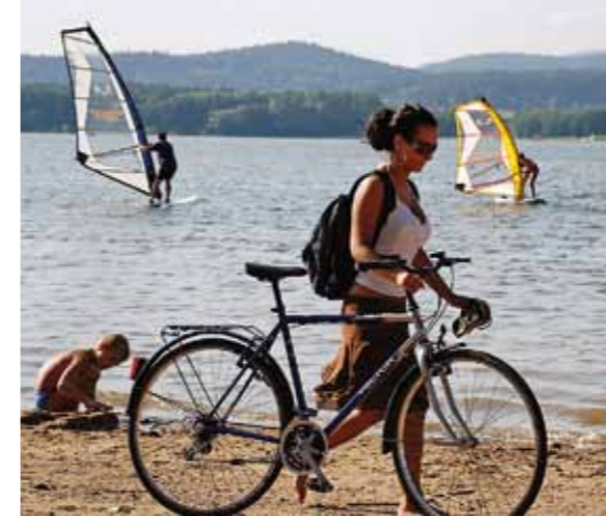
Represa de Lipno

regiões abundantemente povoadas. As cidades rochosas pertencem às verdadeiras jóias naturais. Os alpinistas as conhecem o melhor: registam mais de um milhar de torres rochosas, dando-lhes nomes amigáveis. O sol, a geada, o vento e a água criavam durante milénios também o geoparque europeu único da UNESCO, “Český ráj” („Paraíso Checo“). A denominação é bem achada, naquela região romântica alia-se a variedade de belezas naturais à riqueza de monumentos arquitectónicos – castelos, palácios, a arquitectura popular. Uma outra curiosidade é o sistema de lagoas artificiais na região cultivada da Boémia do Sul – centenas de lagoas artificiais surgiram na sua maior parte na época renascentista como reservatórios de água artificiais originalmente destinados à criação dos famosos peixes checos exportados naquele tempo para as mesas régias em toda a Europa.