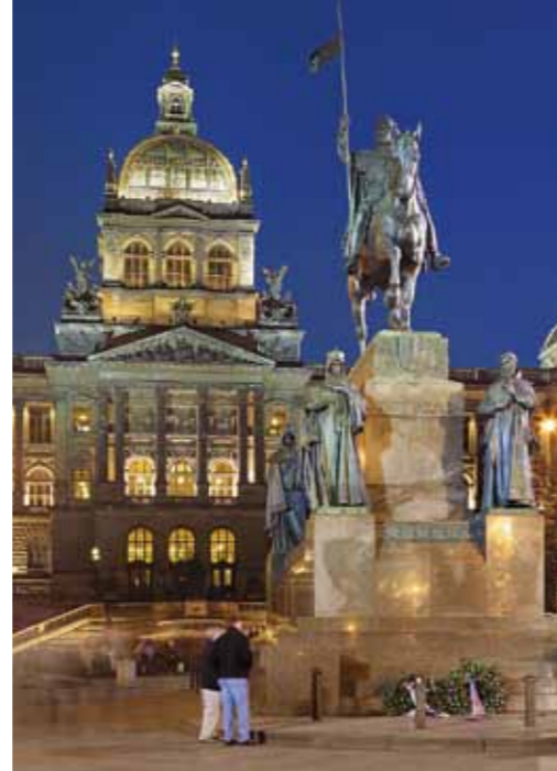
Edifício do Museu e estátua de São Venceslau

Praga tem não somente uma quantidade incrível de monumentos históricos, museus, coleções artísticas, livrarias, teatros, ópera, musicais, cinemas ou clubes musicais, mas também bulevares com lojas luxuosas com vestuário, vidro, jóias e antiguidades, restaurantes excelentes, cafeterias de estilo, cervejarias tradicionais e tavernas populares. Com a história às costas, Praga contemporânea vive de dia e de noite pelo pulso duma metrópole europeia moderna com todos os serviços e oportunidades de divertimento, comércio e instrução. Ficando cansados de tudo isto, relaxem nas áreas verdes dos parques, pratiquem um pouco desportos ou façam uma excursão.