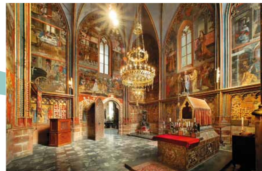
Capela de São Venceslau, patrono dos países checos