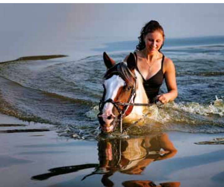
Banho dos cavalos

Pode atravessar de carro a República Checa sem problemas dentro de um dia, mas de pé não a atravessa nem durante toda a Sua vida. O Clube de Turistas Checos trabalha mais de cem anos no aperfeiçoamento da rede densa de caminhos pedestres e pistas de esqui de fundo claramente marcados no comprimento total de 40 000 quilómetros, completados com os mapas detalhados. Os checos gostam também do cicloturismo e no inverno das excursões de esqui de fundo – os caminhos e pistas marcados não os desiludem em nenhuma estação de ano. Prestarão-Lhes informações eruditas sobre as belezas naturais assim como sobre as curiosidades históricas na região, conduzindo-os a cada canto do país, incluindo as regiões mais valiosas – parques nacionais, ecossistemas únicos e regiões e reservas paisagísticas protegidas.