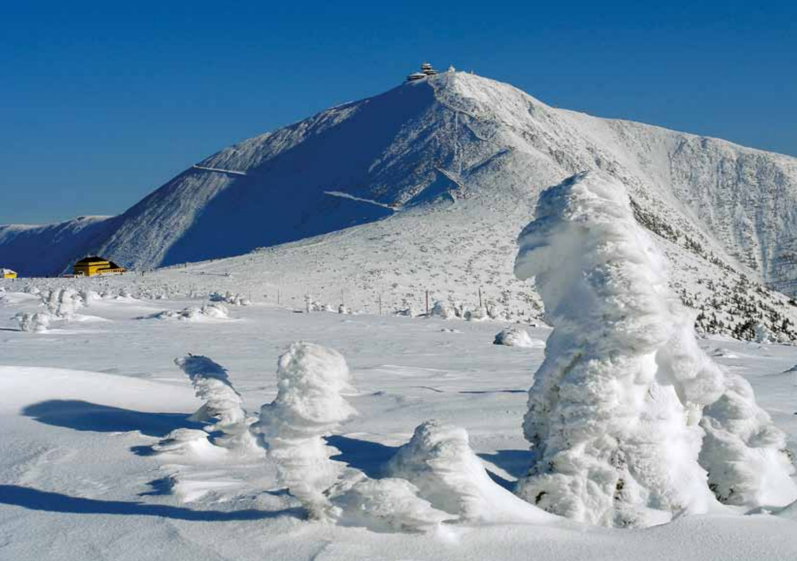
Sněžka – o monte mais elevado da República Checa