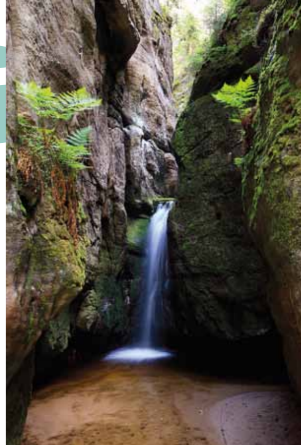
Cascata nas Rochas de Adršpach