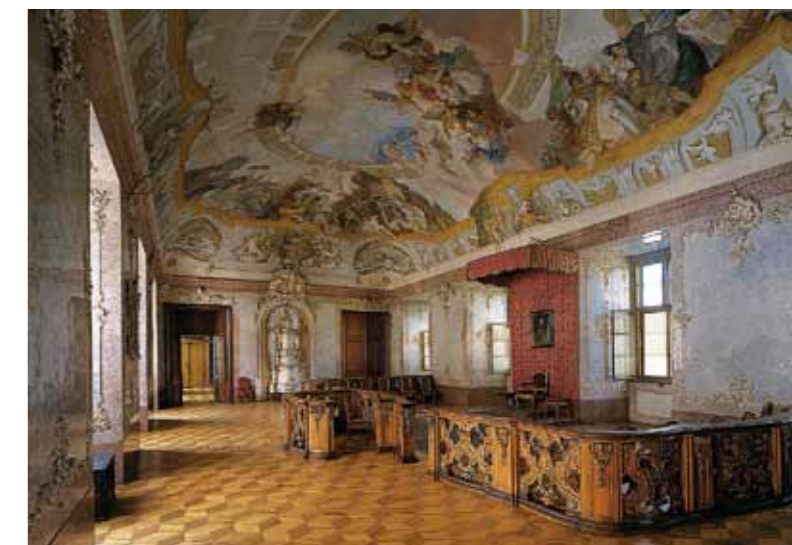
Interior da sala no palácio em Kroměříž

Bezděz, Pernštejn, Loket, Kost, ou os palácios renascentistas de arcadas de Litomyšl, Velké Losiny, Telč, Jindřichův Hradec. Outros, sucessivamente remodelados ficando cada vez mais pomposos e lindos - tais como Český Krumlov, Vranov, Lednice, Valtice, Bouzov, representam um desfile do desenvolvimento dos estilos arquitectónicos assim como um manual claro da história que atravessou a Europa Central. Fazem parte dos tours de visita os interiores magníficos equipados com as colecções únicas e muitas vezes também jardins, parques e tapadas bonitas. Em muitos lugares realizam-se festas históricas, visitas nocturnas, representações teatrais ou concertos.