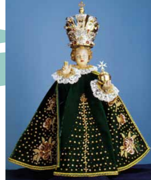
Menino Jesus de Praga

O convento em Vyšší Brod com a valiosa biblioteca barroca, a igreja da Virgem Santa Bárbara – patrona dos mineiros em Kutná Hora, a área de romaria no Monte Verde perto de Žďár nad Sázavou, a sede arcebispa de verão com jardins em Kroměříž – estas são apenas poucas amostras das obras mestras arquitectónicas espalhadas em todo o país; a Igreja Católica e as ordens religiosas pertenciam desde a Idade Média na Boémia aos investidores mais ricos. Templos monumentais assim como igrejas simples rurais, grandiosos conventos assim como capelas modestas, lugares de romaria majestosos nas colinas visíveis de longe, residências esplêndidas com colecções magníficas assim como uma cruz simples entre duas tílias no meio dos campos: doze séculos quando o desenvolvimento político e social dos países checos foi acompanhado pela crença cristã deixou o seu vestígio na pitoresca paisagem checa, em cada cidade assim como em cada aldeia.