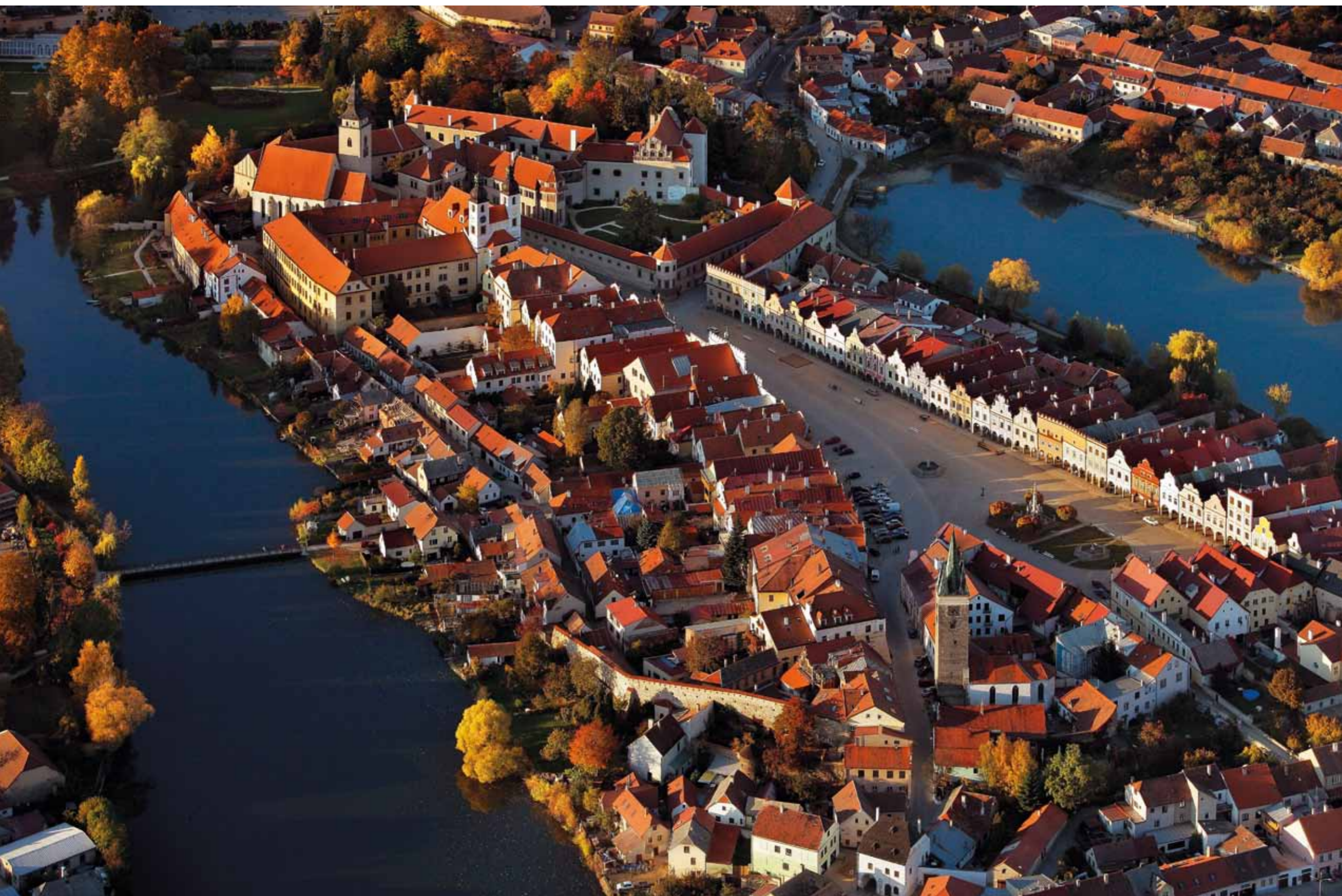
Vista aérea sobre a cidade histórica de Telč