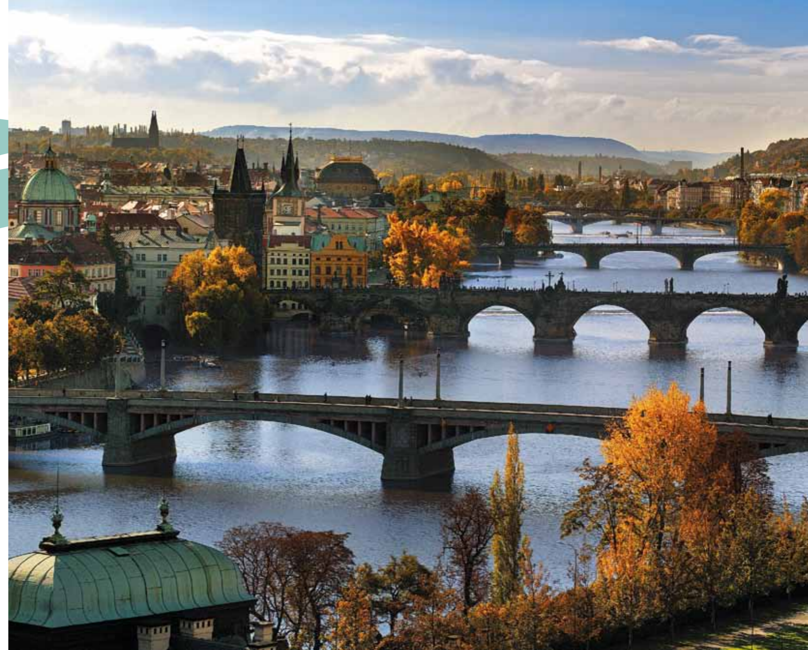
Pontes de Praga

Praga tem não somente uma quantidade incrível de monumentos históricos, museus, coleções artísticas, livrarias, teatros, ópera, musicais, cinemas ou clubes musicais, mas também bulevares com lojas luxuosas com vestuário, vidro, jóias e antiguidades, restaurantes excelentes, cafeterias de estilo, cervejarias tradicionais e tavernas populares. Com a história às costas, Praga contemporânea vive de dia e de noite pelo pulso duma metrópole europeia moderna com todos os serviços e oportunidades de divertimento, comércio e instrução. Ficando cansados de tudo isto, relaxem nas áreas verdes dos parques, pratiquem um pouco desportos ou façam uma excursão.