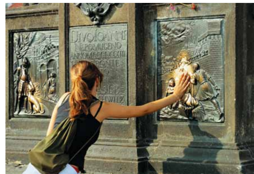
Ponte Carlos – para trazer felicidade