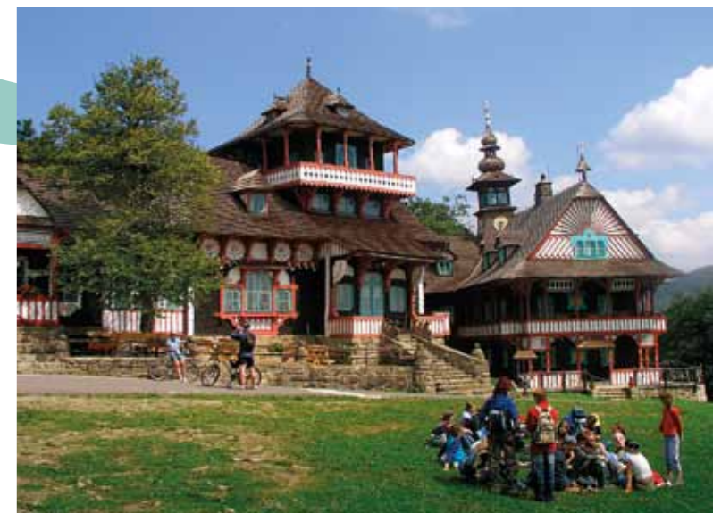
Pustevny em Beskydy