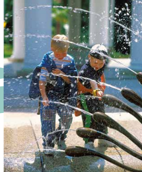
Crianças junto ao chafariz

Festival de Música Janáček e Luhačovice [ www.janacek.cz/festival-luhacovice ]