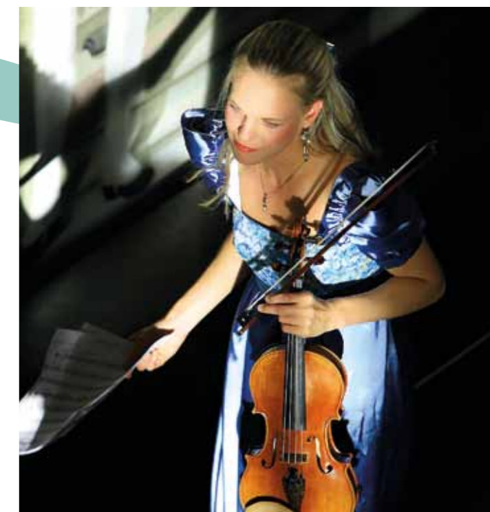
No concerto em Český Krumlov