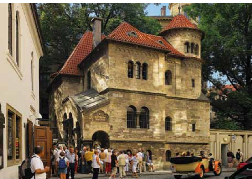
Sala de cerimónias do Cemitério Judaico