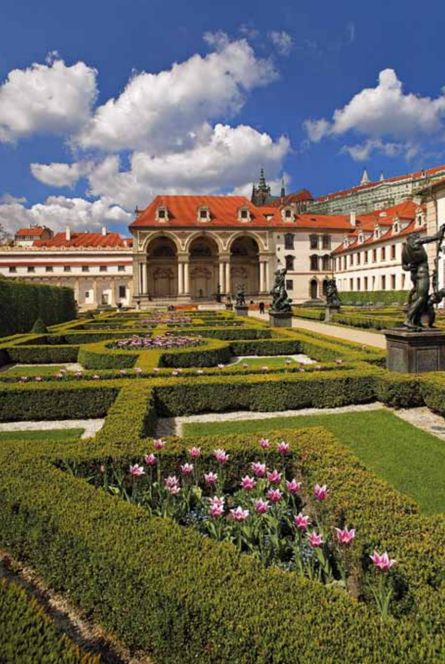
Jardim de Wallenstein