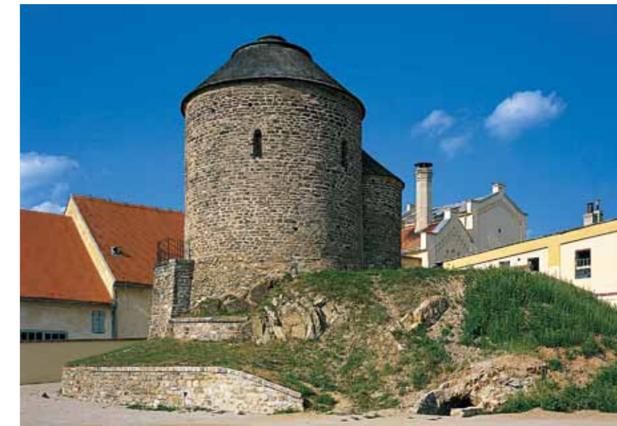
Rotunda de Santa Catarina em Znojmo

castelo acima do rio (o segundo mais grande no país depois do Castelo de Praga), Kutná Hora, cidade régia que enriqueceu na Idade Média com a extracção de prata, as pérolas renascentistas sem par de Telč e Slavonice, as cidades arcebispaís de Olomouc e Kroměříž, a cidade vinícola de Znojmo ou Mikulov assim como o centro da Morávia do Sul – Brno.