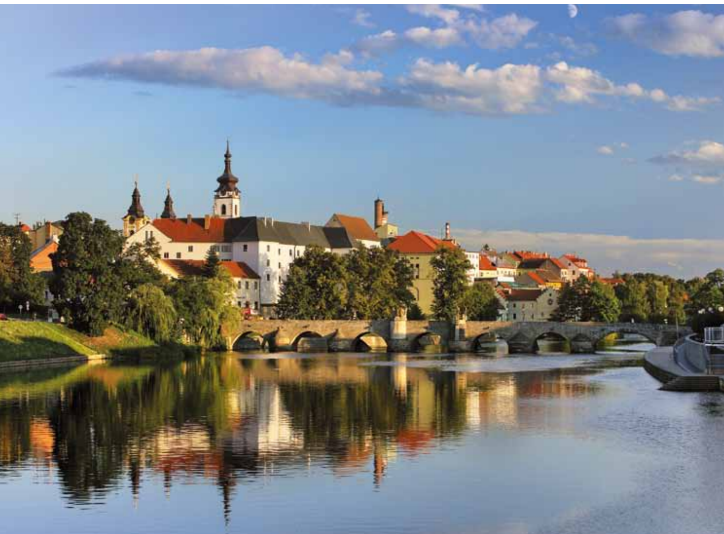
Písek, cidade da Boémia do Sul, com a ponte mais antiga na Boémia

Editado pelo M.I.P.Group, Ltda. para a CzechTourism Praga 2010