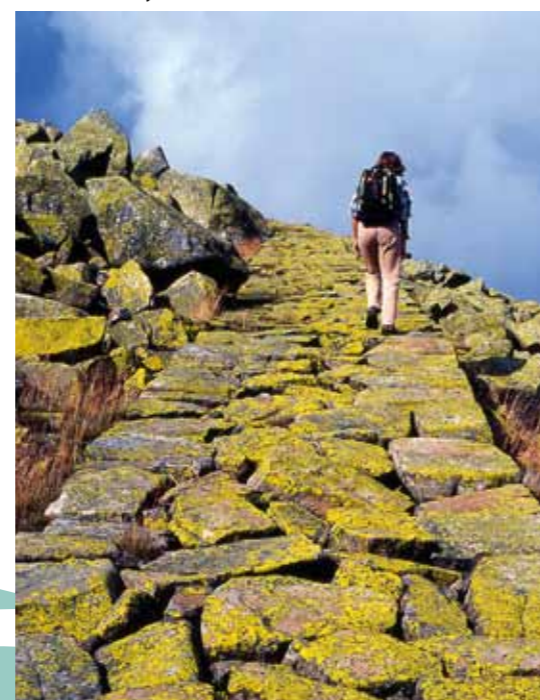
A caminho de Vysoké kolo

Nas imagens de satélite vê-se no centro da Europa uma bacia marcante rodeada pela coroa de montanhas – a República Checa. Ao longo da maioria das fronteiras estatais estendem-se as cristas de montanhas, no centro a paisagem é muito bem variada e acidentada. Os terrenos montanhosos moderadamente ondulados alternam com as baixas férteis ao longo dos rios vivificantes, florestas profundas assim como