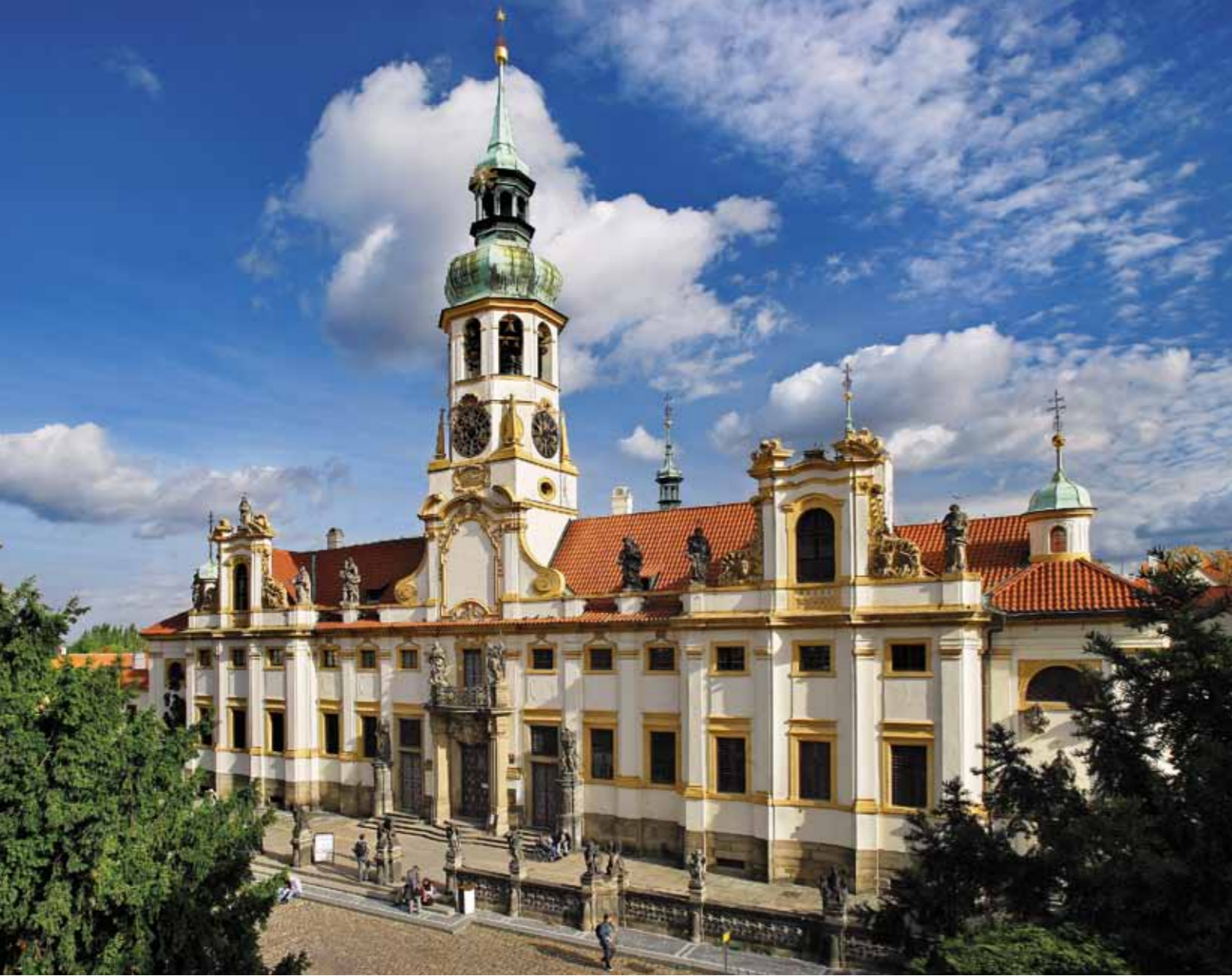
Loreta de Praga