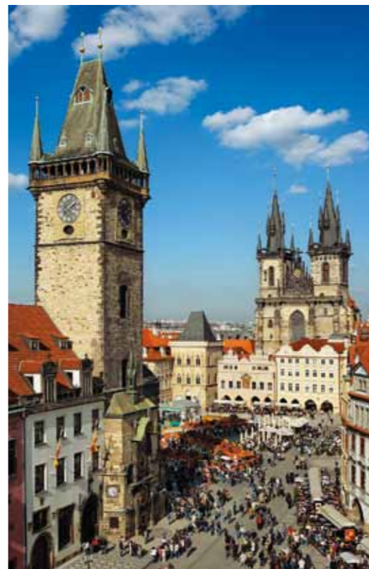
Praça da Cidade Velha

assim como artistas de todo o mundo. Uma especial atmosfera inspiradora de Praga fascina os estrangeiros desde os tempos romanos até hoje. Os bairros históricos mantiveram até hoje o maior encanto: a Cidade Velha única com a praça espaçosa onde cada hora o relógio medieval badala o tempo, com a universidade, com uma floresta de torres de igrejas assim como com os restos do vasto gueto judeu; o Pequeno Bairro nas encostas debaixo do Castelo de Praga – um entrançado de ruelas sinuosas e escadas, o bairro cheio de monumentos religiosos assim como de grandes palácios de nobreza e jardins refinados; Hradčany – o pitoresco bairro nas vizinhanças da sede impressionante dos soberanos checos.