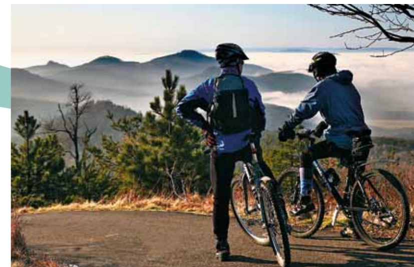
Ciclismo nas montanhas