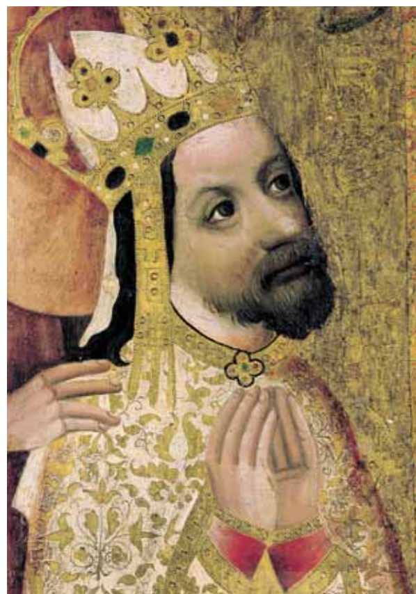
Imagem votiva de Carlos IV