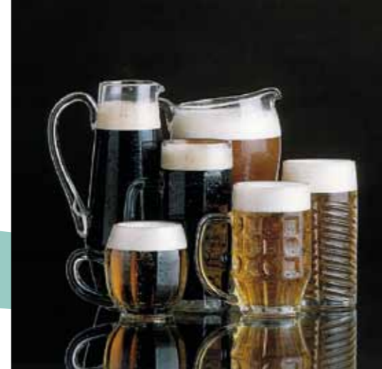
A cerveja é a bebida mais preferida checa

natas e legumes) com a carne de vaca e bolos de massa. A verdadeira jóia nacional é a cerveja checa. A cerveja produz-se segundo as receitas muito antigas e de excelentes matérias-primas nacionais em dezenas de fábricas de cerveja, não sendo de admirar que os checos são os mais assíduos consumidores de cerveja no mundo. Também os vinhos checos e moravos, sobretudo brancos, têm uma muito boa qualidade. A famosa região vinícola é a Morávia do Sul – os mais diversos programas vinícolas familiarizam os visitantes com o vinho, com as caves vinícolas, mas também com os monumentos, com as últimas tradições populares vivas e com a hospitalidade da gente local.