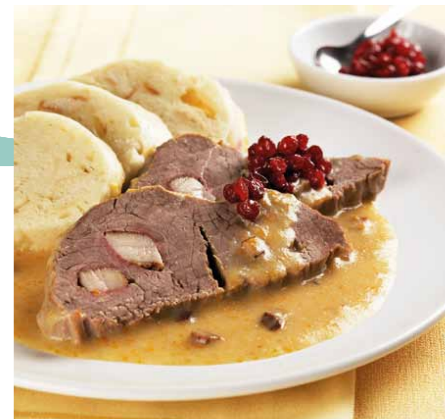
“Svíčková” - Filé mignon com molho de natas e legumes, servido com bolos de massa tradicionais checos