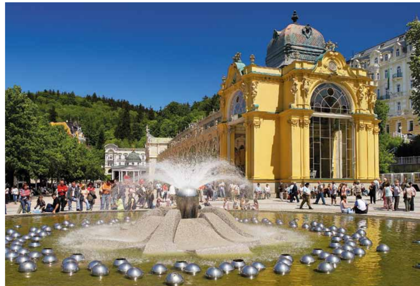
Fonte Cantante em Mariánské Lázně

mais alta gostava das fontes quentes termais daqui – no decurso de séculos as termas hospedavam tais personagens como Mozart, Beethoven, Tchaikovsky, Gogol, Goethe, Kafka, Freud, Edison, Schopenhauer, Marx ou Casanova. Para os patriotas checos estava em voga ir às termas moravas de Luhačovice ou às termas de Jeseník procurar lá o “médico da água” popular, Vincenz Priessnitz, cujos métodos simples e enérgicos, tais como a compressa famosa contra a febre, são muito eficientes até hoje.