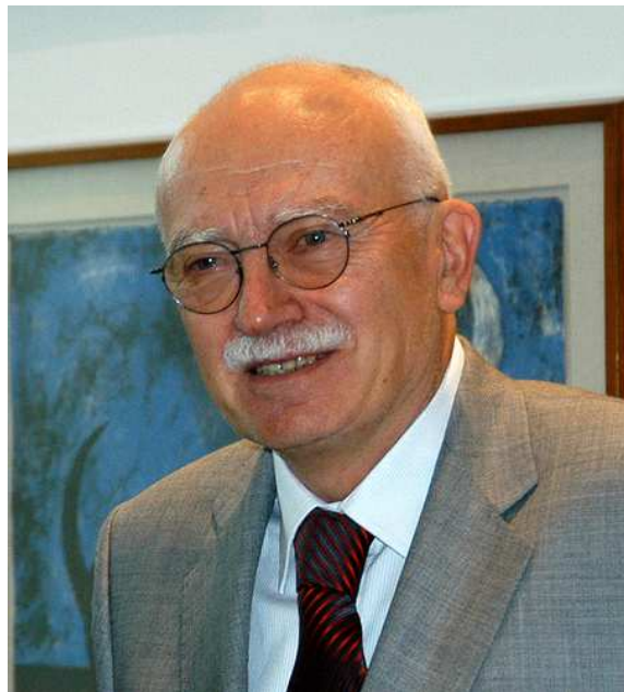
Karel Dyba velvyslanec a stálý představitel ČR při OECD