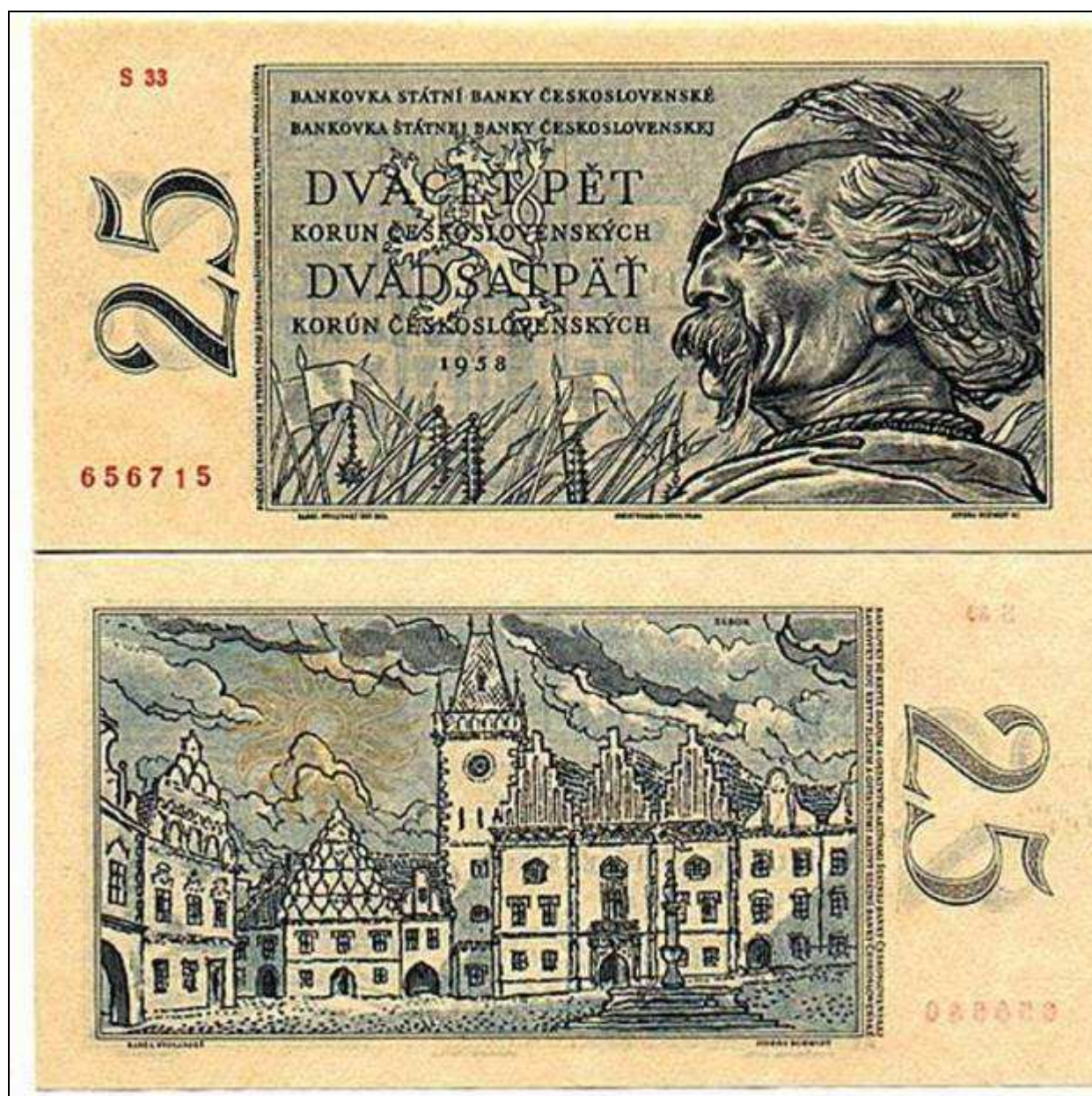
Bankovka 25 Kč z let 1958 - 1971.