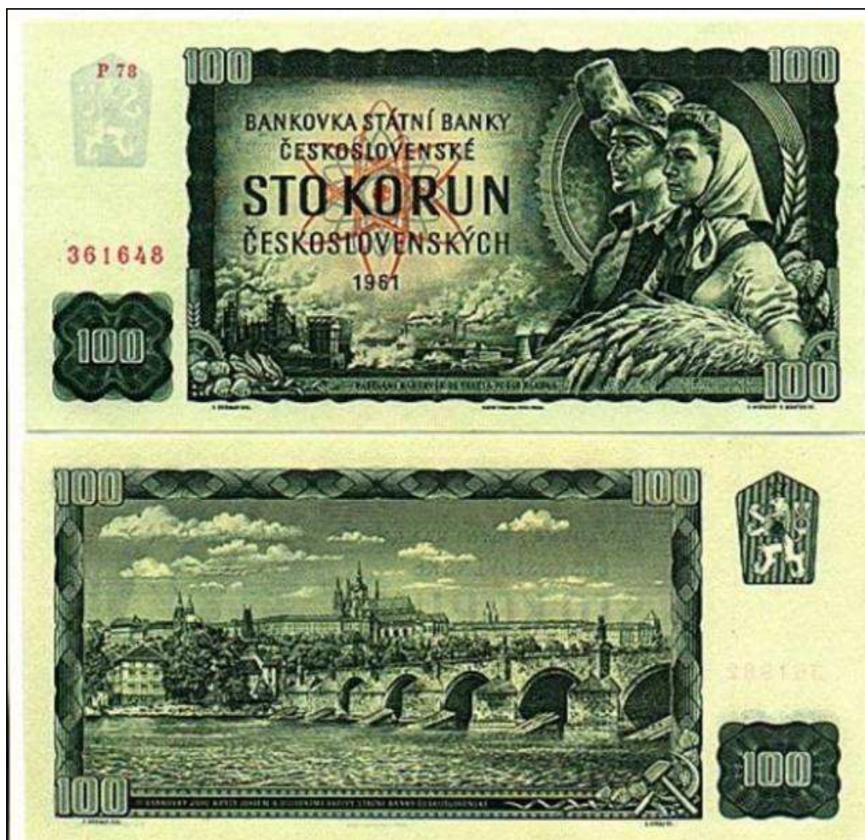
Bankovka 100 Kčs z roku 1961.

Je rekordmanem a platila přes třicet let. Původně ji měla nahradit nová stokoruna s Klementem Gottwaldem, po pádu komunismu však byla prodloužena platnost staré stokoruny až do rozdělení Československa v únoru 1993.