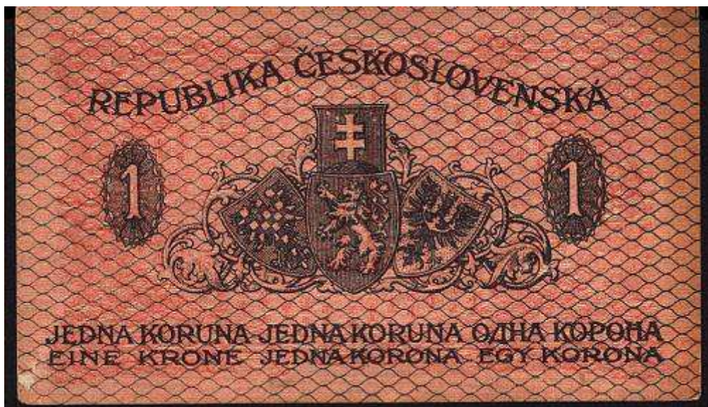
PRVNÍ BANKOVKY ROKU 1919