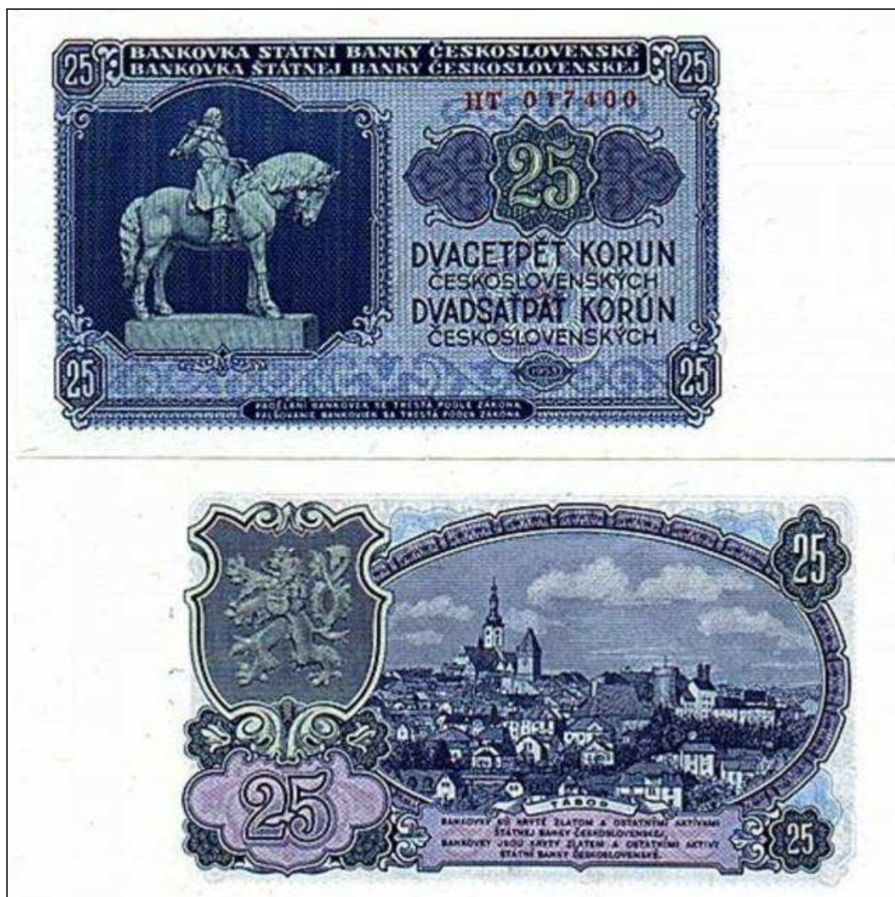
Bankovka 25 Kčs

která platila od měnové reformy (1953) zhruba deset let. Vytisknuta byla v Moskvě.