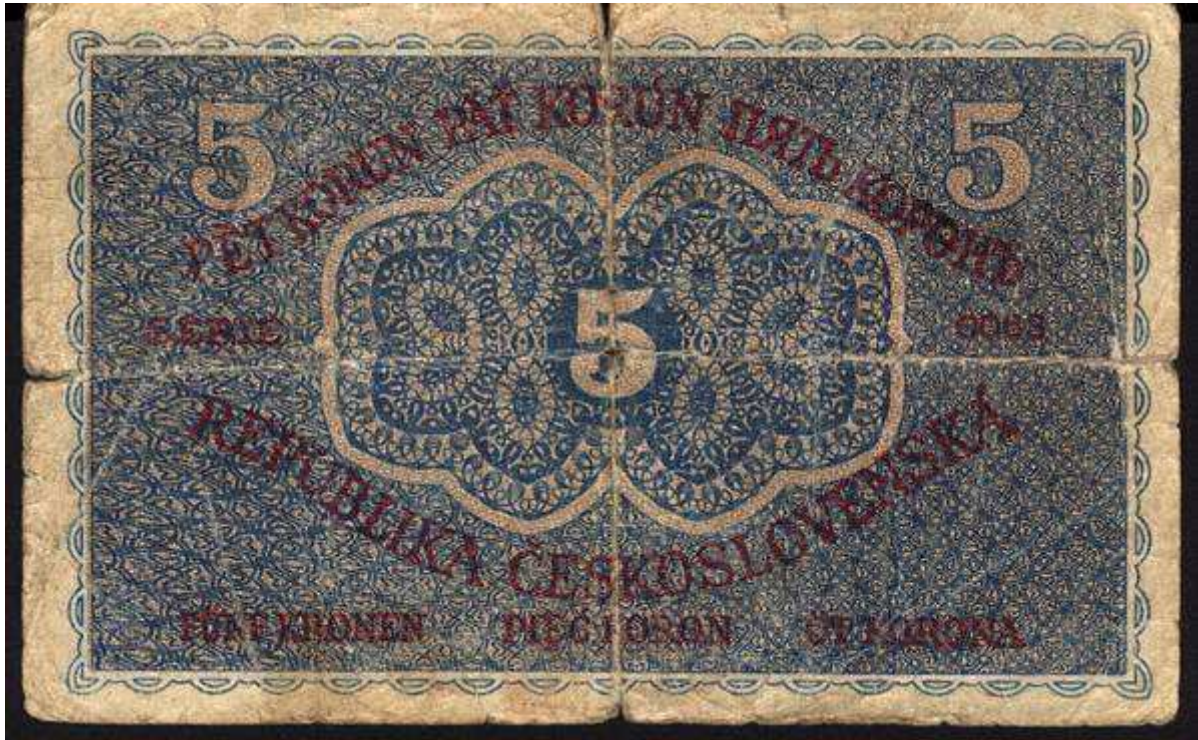
PRVNÍ BANKOVKY ROKU 1919