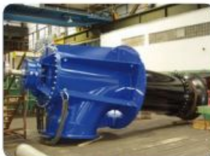
New SIGMA pumps 1400-AQSV (at work)