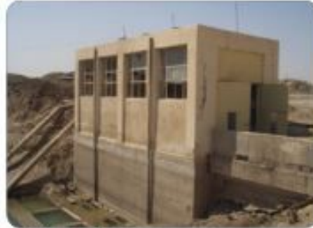
Kaiseba 2 - old building