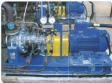
SIGMA process pump for Refinery in Baiji