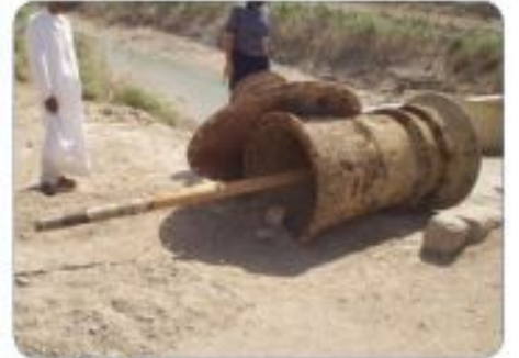
Kaiseba 2 - old pumps