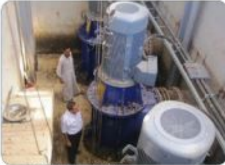
New vertical SIGMA pumps 800-AQTV