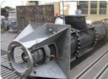
New vertical pumps 800-AQTV at SIGMA factory