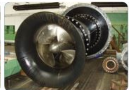
New SIGMA pumps 1400-AQSV (suction part)