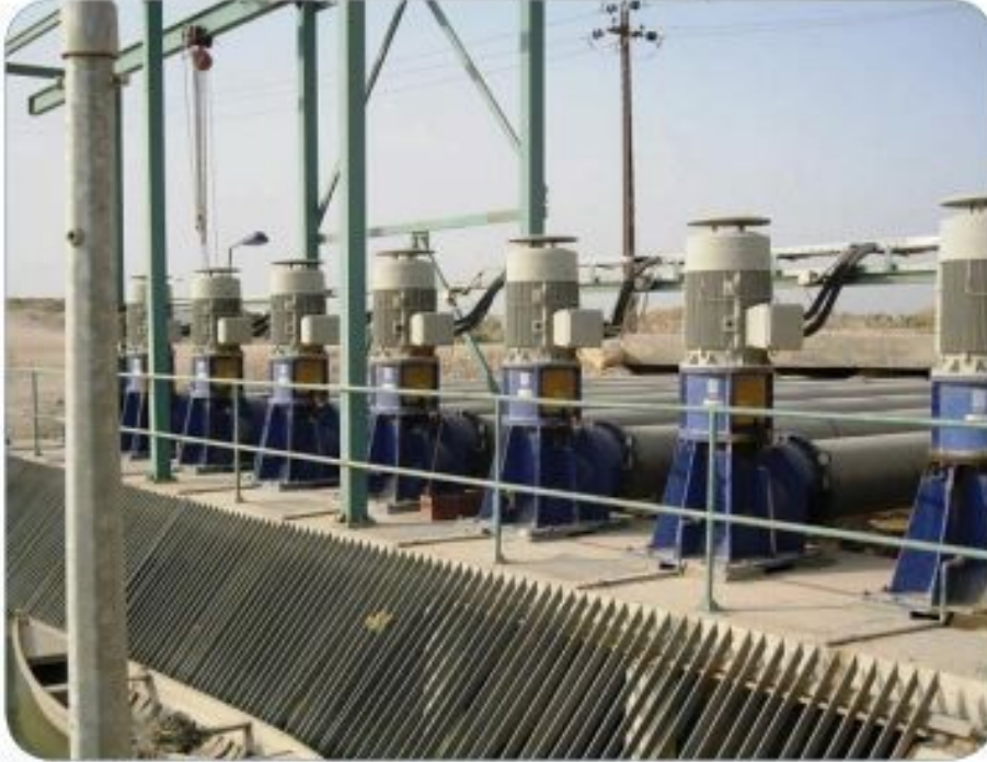
Drainage pumping station - DRAIN 22 (pump units)