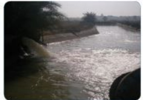
Al Hindiya Babal Barrage - discharge from the old pumping station