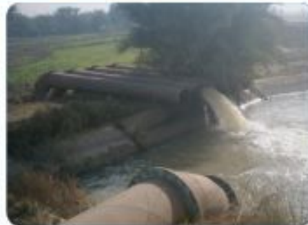
Al Hindiya Babal Barrage - old pumping station