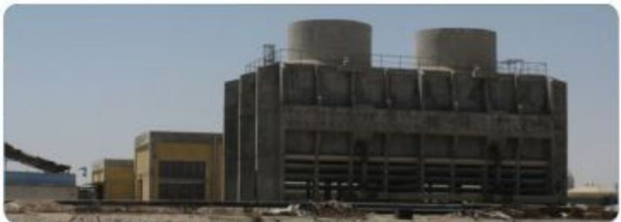
Basra Refinery - pumping station and cooling towers