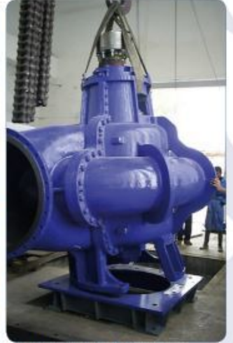
New SIGMA pump W-QN-800-LB - erection in process.