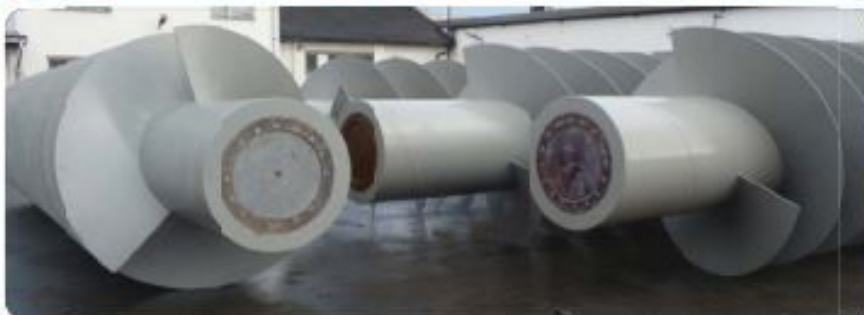
New screw pumps for PS Abu Shabkha