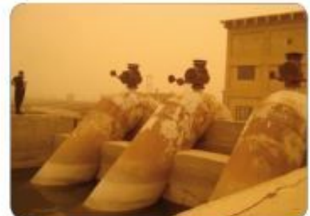
Al Shomally drainage pumping station - old building