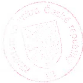
Mgr. Alan Stryja zástupce vedoucího oddělení pro pracovní migraci

Proti tomuto usnesení lze podat odvolání ke Komisi pro rozhodování ve věcech pobytu cizinců, a to dle ustanovení § 81 odst. 1 zákona č. 500/2004 Sb., správní řád, ve spojení s § 170b odst. 1 zákona č. 326/1999 Sb., o pobytu cizinců na území České republiky a o změně některých zákonů, v platném znění. Podle ustanovení § 86 odst. 1 správního řádu se odvolání podává u odboru azylové a migrační politiky Ministerstva vnitra České republiky, a to dle ustanovení § 83 odst. 1 správního řádu ve lhůtě do 15 dnů ode dne oznámení tohoto usnesení. Podle ustanovení § 76 odst. 5 správního řádu nemá odvolání proti tomuto usnesení odkladný účinek.