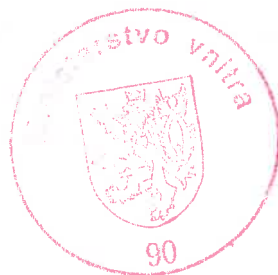
Mgr. Richard Kordecký ministerský rada

Proti tomuto usnesení lze podat odvolání ke Komisi pro rozhodování ve věcech pobytu cizinců, a to dle ustanovení § 81 odst. 1 zákona č. 500/2004 Sb., správní řád, ve spojení s § 170b odst. 1 zákona č. 326/1999 Sb., o pobytu cizinců na území České republiky a o změně některých zákonů, v platném znění. Podle ustanovení § 86 odst. 1 správního řádu se odvolání podává u odboru azylové a migrační politiky Ministerstva vnitra České republiky, a to dle ustanovení § 83 odst. 1 správního řádu ve lhůtě do 15 dnů ode dne oznámení tohoto usnesení. Podle ustanovení § 76 odst. 5 správního řádu nemá odvolání proti tomuto usnesení odkladný účinek.