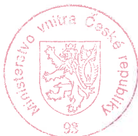
Ing. Viera Kubienková ministerský rada

Proti tomuto usnesení lze podat odvolání ke Komisi pro rozhodování ve věcech pobytu cizinců, a to dle ustanovení § 81 odst. 1 správního řádu, ve spojení s ustanovením § 170b odst. 1 zákona č. 326/1999 Sb. Podle ustanovení § 86 odst. 1 správního řádu se odvolání podává u odboru azylové a migrační politiky Ministerstva vnitra České republiky, a to dle ustanovení § 83 odst. 1 citovaného právního předpisu, ve lhůtě do 15 dnů ode dne oznámení tohoto usnesení. Podle ustanovení § 76 odst. 5 správního řádu nemá odvolání proti tomuto usnesení odkladný účinek.