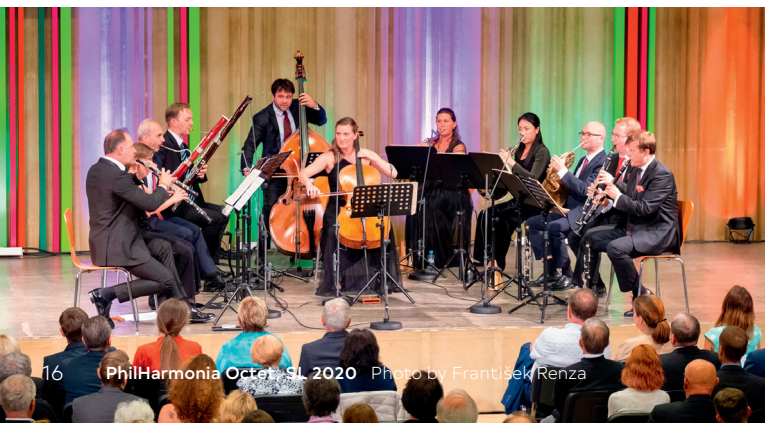
PhilHarmonia Octet, 31. 2020