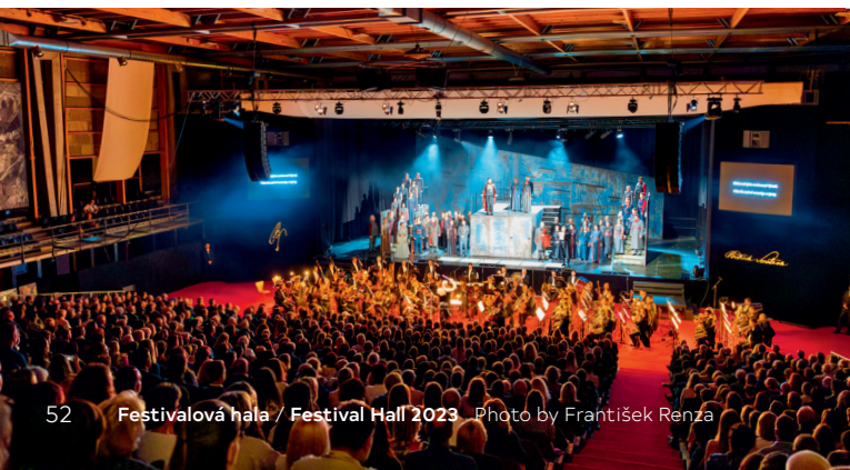
52 Festivalová hala / Festival Hall 2023