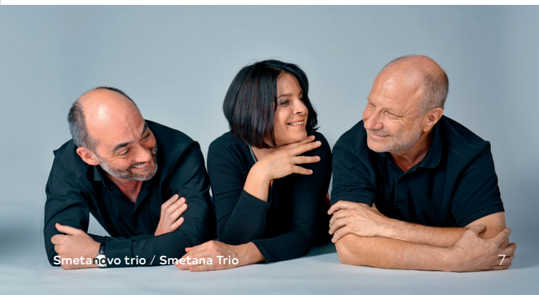
Smetanovo trio / Smetana Trio