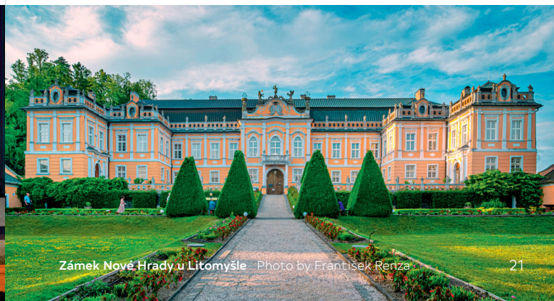
Zámek Nové Hradky u Litomyšle