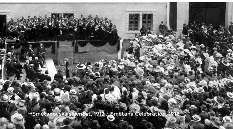
Smetanovská slavnost, 1912 / Smetana Celebration, 1912