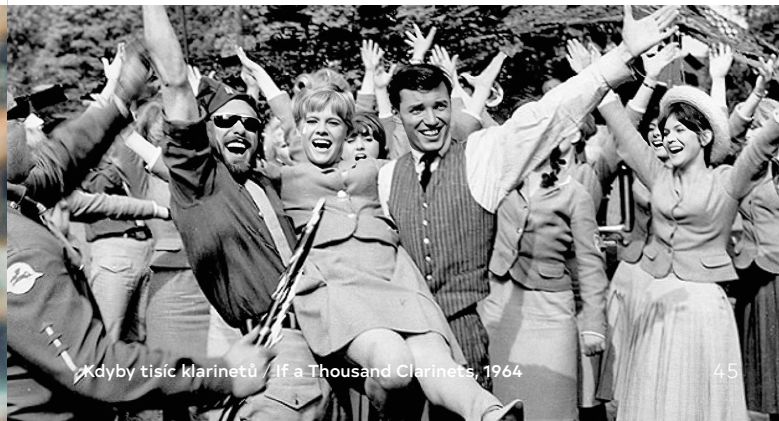
45 Kdyby tisíc klarinetů / If a Thousand Clarinets, 1964