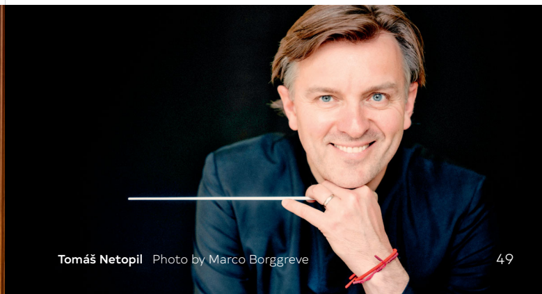
Tomáš Netopil