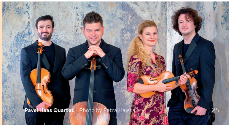
Pavel Haas Quartet