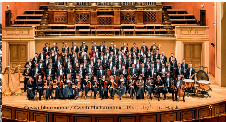
Česká filharmonie / Czech Philharmonic