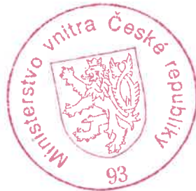
Ing. Viera Kubičková ministrský rada

Proti tomuto usnesení lze podat odvolání ke Komisi pro rozhodování ve věcech pobytu cizinců, a to dle ustanovení § 81 odst. 1 správního řádu, ve spojení s ustanovením § 170b odst. 1 zákona č. 326/1999 Sb. Podle ustanovení § 86 odst. 1 správního řádu se odvolání podává u odboru azylové a migrační politiky Ministerstva vnitra České republiky, a to dle ustanovení § 83 odst. 1 citovaného právního předpisu, ve lhůtě do 15 dnů ode dne oznámení tohoto usnesení. Podle ustanovení § 76 odst. 5 správního řádu nemá odvolání proti tomuto usnesení odkladný účinek .