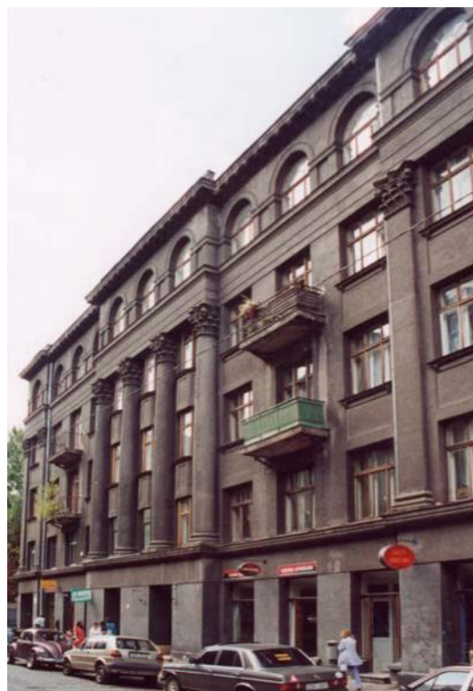
Dnešní podoba domů, kde bývalo sídlo čs. zastupitelských úřadů, vlevo dům Elizabetes 41/43, vpravo Strēlnieku 9