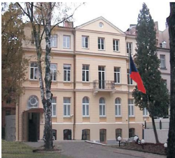
velvyslanectví české republiky v Rize 2001

dokument vydaný k 80 letům nájemných vztahů a k 10. výročí jejich znovuoobnovení