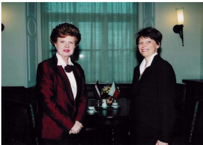
Přijetí velvyslankyně Jana Bulenové u prezidentky Lotyšské republiky Vairy Vike-Freibergy

V roce 1998 Česká republika povýšila statut svých diplomatických vztahů s Lotyšskem, otevřela v Rize rezidentní velvyslanectví a od září 1998 zahájila svou činnost v Lotyšsku velvyslankyně Jana Bulenová. Od této doby se datuje též významné zintenzivnění vzájemných vztahů.