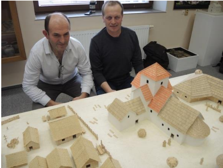
Dvojice přímých potomků velkomoravských velmožů u makety kostela v hradištských Sadech.