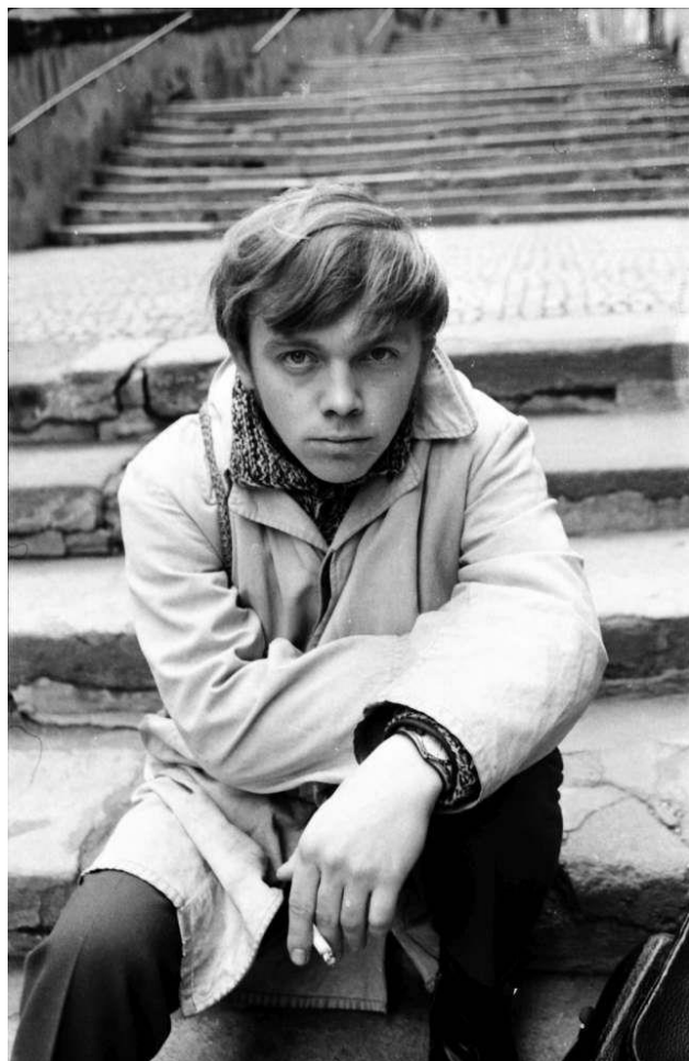
Písničkář Karel Kryl v roce 1969

Roku 1990 zvítězilo v soutěži hudebního časopisu Rock & Pop o "československou desku desek". Památné album písničkáře Karla Kryla Bratříčku zavírej vrátka, vydané na značce Panton přesně 24. března 1969, patří i po 50 letech k nejlepší sbírce protestsongů, které se v moderní české hudbě zrodily.