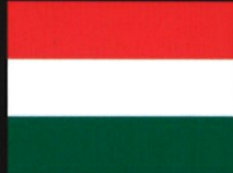
페케테 코바치 코르닐 Fekete-Kovács Kornél 헝가리 Hungary