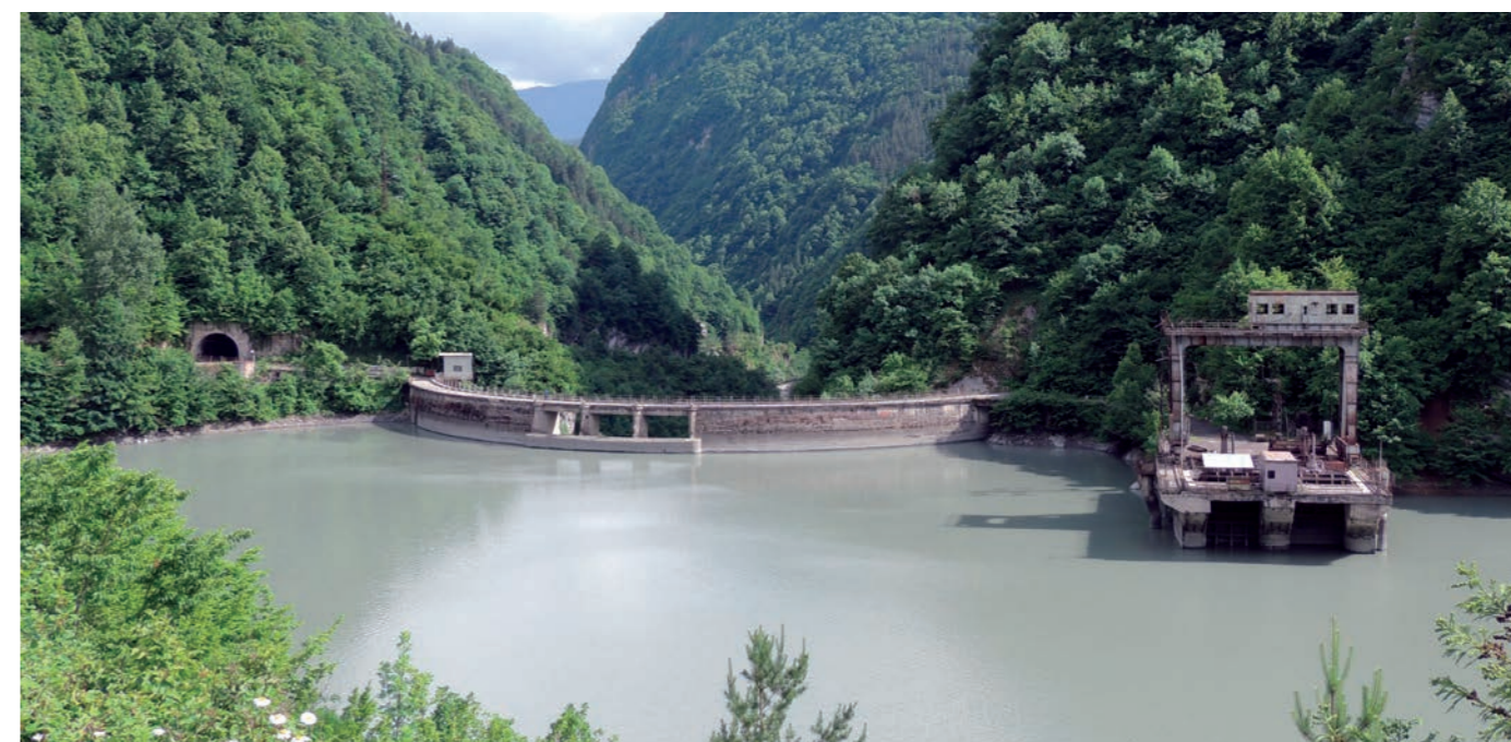
» Elektrárna Ladjanuri se nachází na vodním toku, který vznikl přesměrováním řeky Tskhenistskali do řeky Ladjanuri. Jde o podzemní elektrárnu s instalovaným výkonem více než 110 MW. Zahájila provoz v roce 1960, součástí skupiny ENERGO-PRO je od roku 2007.