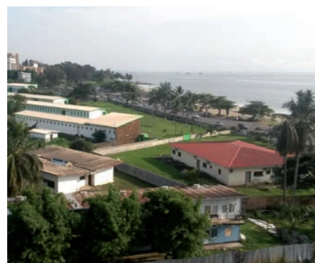
Na pojišťování vývozu celých nemocnic do různých částí světa spolupracuje EGAP s rakouskou pojišťovnou OeKB Versicherung. Na snímku nemocnice, kterou postavily české firmy v africkém Gabonu. Více informací o zdravotnickém vývozu čtěte na stranách 4-6.

podíly, z pohledu EGAP se snižuje jeho celková pojistná angažovanost. Tímto snížením se tak vytváří další kapacita pro pojišťování dalších obchodních případů českých firem.