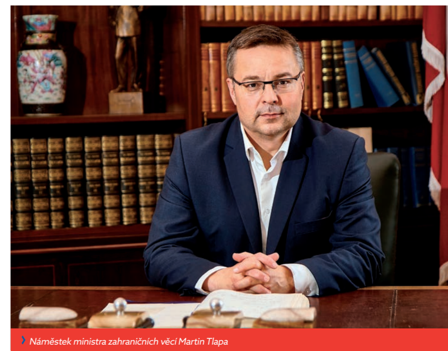
» Náměstek ministra zahraničních věcí Martin Tlapa

Často slyšíme z úst politiků i ekonomů, že je potřeba klást důraz právě na zvyšování konkurenceschopnosti. Paul Krugman , nositel Nobelovy ceny za ekonomii z roku 2008, poukázal na úskalí prvoplánové snahy o zvyšování konkurenceschopnosti národních ekonomik. Ta může vést k protekcionismu, obchodním válkám, umožňuje