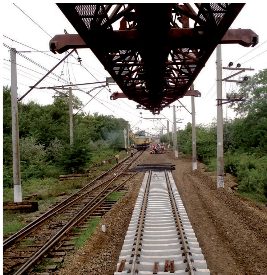
» V rámci generální opravy železnice v Ázerbájdžánu zajišťují Češi dodávky kolejnic a dalších výrobků, železničních strojů, malé mechanizace, ale také projektovou činnost, stavební dozor a geologický průzkum.

Generální oprava tratě v celkové délce více než 900 km začala v roce 2011. První etapa rekonstrukce byla ukončena, nyní české firmy realizují druhou etapu, jež bude dokončena v roce 2019. Celková hodnota zakázky se pohybuje v řádu stovek mil. Kč.