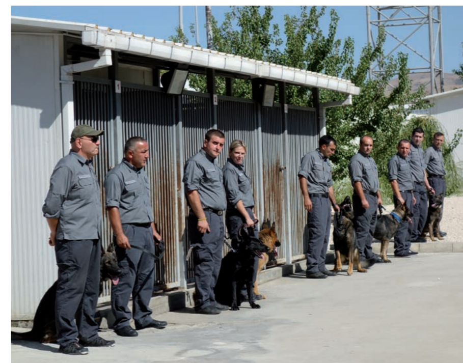
Do boje proti pašerákům drog se zapojili také čeští kynologové. Ve spolupráci s gruzínskými celníky bude vycvičeno celkem 16 služebních psů.