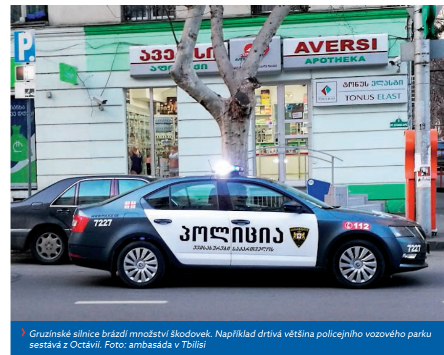
Gruzínské silnice brázdí množství škodovek. Například drtivá většina policejního vozového parku sestává z Octavií.

K dalším pozitivům patří, že s více než stovkou zemí světa má Gruzie bezvízový styk (včetně ČR) k pobytu až na 1 rok. Vyřízení dlouhodobého pobytového povolení je rovněž velmi