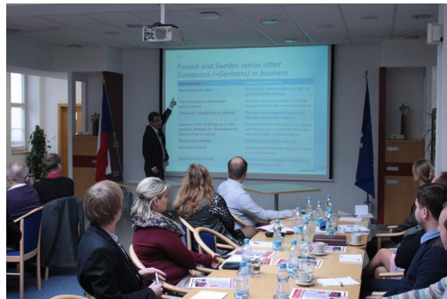
Obchodní příležitosti v severských zemích rok 2014