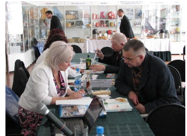
Mise do VO