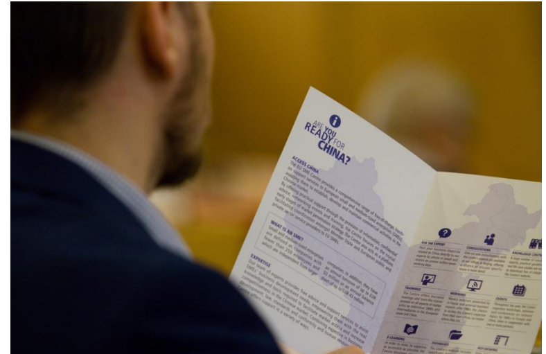
Seminář k příležitostem podnikání v Asii se zaměřením na Indii a Čínu rok 2015