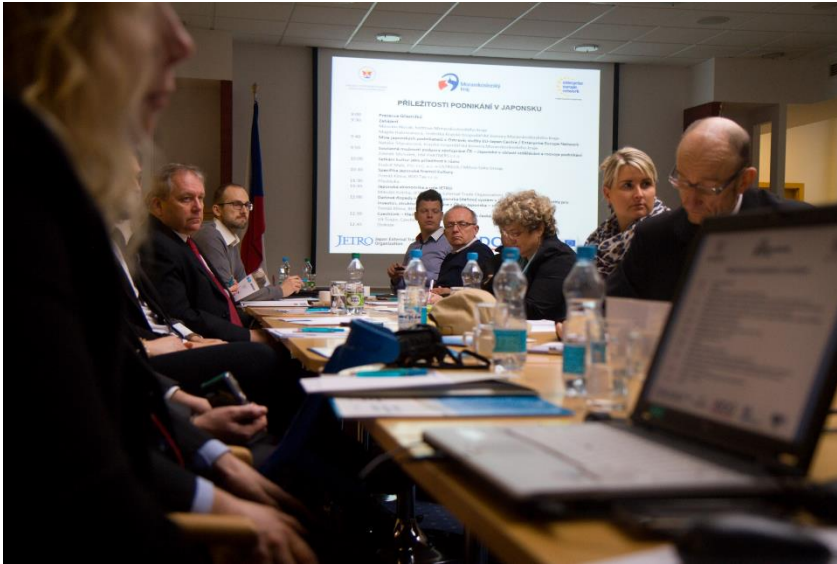
Teritoriální seminář k podnikání v Japonsku rok 2015