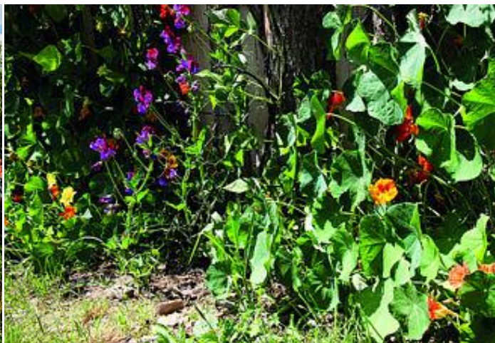
I popínavky u plotu byly nejen hezké, ale také jedlé.

Z pohledu kolemjdoucího je babiččina zahrádka společenství máty, šnytlíku a popínavých růží. Ano, je trochu neuspořádaná a v létě i zdivočelá. Utíkají z ní květiny k sousedovi a dovnitř se stěhují luční květy. Komu by ale vadily kopretiny či pomněnky? Z ptačí perspektivy je babiččina zahrádka veselá strakatina, kam se vždycky vejde i lavička.