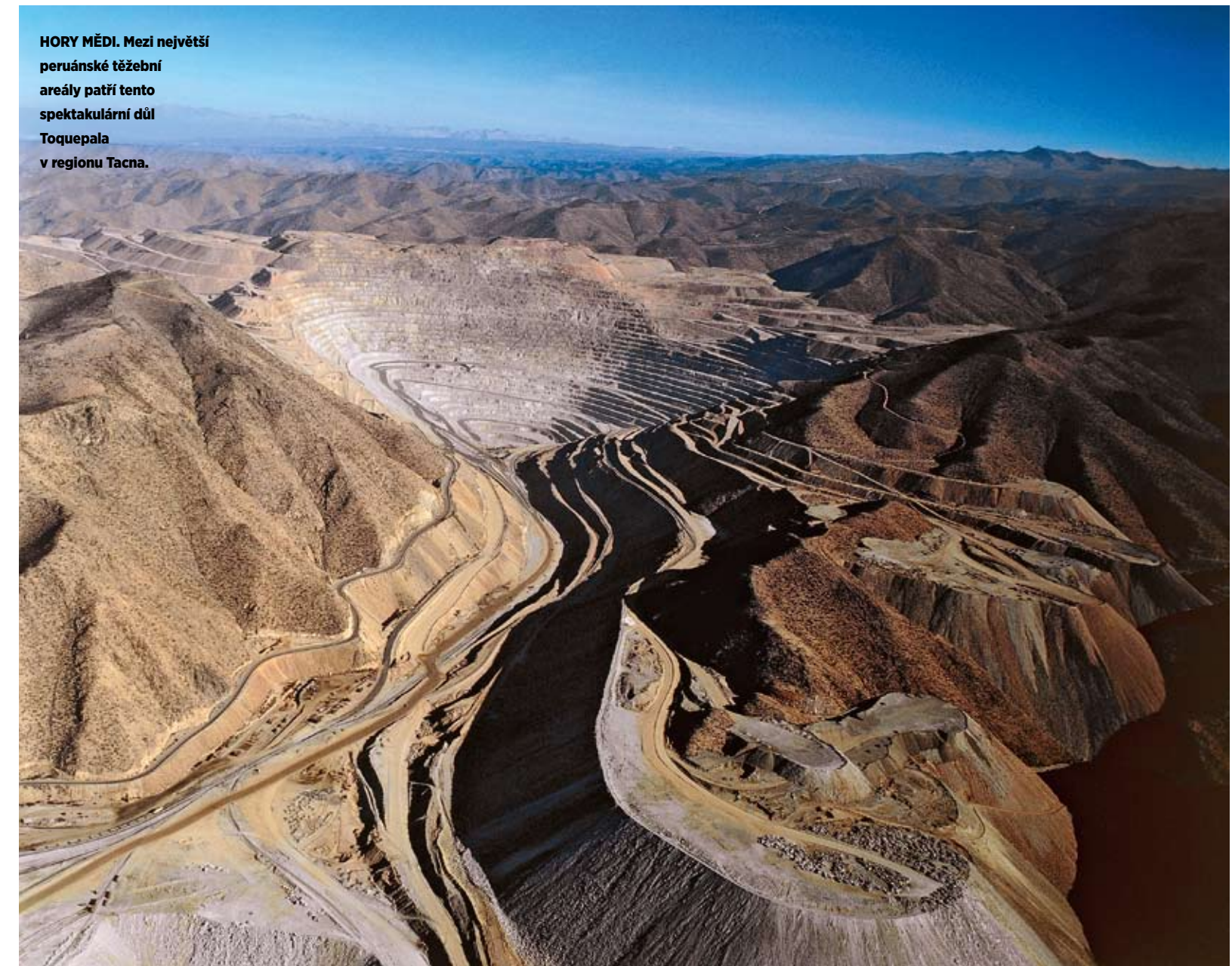
HORY MĚDI. Mezi největší peruánské těžební areály patří tento spektakulární důl Toquepala v regionu Tacna.

Platební schopnost velkých korporací v Peru je úzce sledována mezinárodními ratingovými agenturami. V průběhu nadcházejících měsíců není vyloučeno snížení ratingu, pokud se poptávka po kovech, jako je měď, zinek, olovo a stříbro, na světových trzích nevzpamatuje po loňském poklesu. Z největších těžebních společností s aktivitami v Peru (Southern Copper, Hochschild, Volcan, Minsur a Buenaventura) je vzhledem k současnému vývoji jeví jako finančně