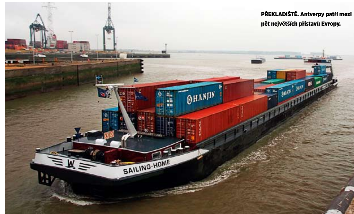
PŘEKLADIŠTĚ. Antverpy patří mezi pět největších přístavů Evropy.

Donedána bylo Česko napojeno pouze na tři z devíti evropských koridorů a všechny byly orientované na východ. Jde o koridor RFC 5 (Balt-Jadran), koridor RFC 7 (Orient/Východo-středomořský) a koridor RFC 9 (Česko-slovenský, zkráceně