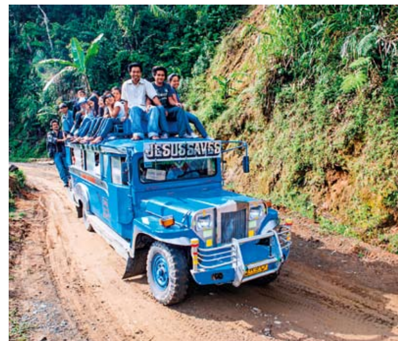
PRODLOUŽENÝ JEEP. Symbolem filipínské dopravy je svérázné vozítko zvané jeepney, říká Miloš Podpěra.

Nutno říct, že už jen malé povstalecké skupinky jsou jen na úplně nejvzdálenějším jihovýchodním cípu ostrova a dalších malých ostrůvkách směrem k Borneu. V poslední době se islamisté poprali hlavně mezi sebou, vláda totiž uzavřela před dvěma roky s povstalci smlouvu o příměří. Minimálně na dvou třetinách Mindanaa se lze dnes pohybovat naprosto normálně.