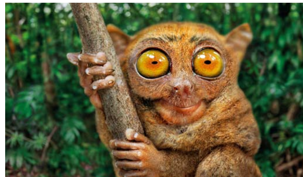
PRO PŘÍRODU. Čeští vědci pomáhají zachránit symbol filipínské přírody – neodolatelné nártouny.

Nedílnou součástí ochrannářských aktivit Záchranného centra pro ohrožené živočichy Talarak i Nadace Talarak je osvětová a vzdělávací činnost mezi obyvateli ohrožených pralesů, především na ostrově Negros, kde se záchranné centrum nachází. Pravidelné návštěvy expertů v centru i vzdělávací činnost nese své ovoce – centrum často získá některé vzácné druhy zvířat jako dar nebo je kolikrát schopno vzácného jedince takřikajíc zachránit přímo z pekáče okolních domorodců. Stanice občas získává i zvířata zabavená na černém trhu.