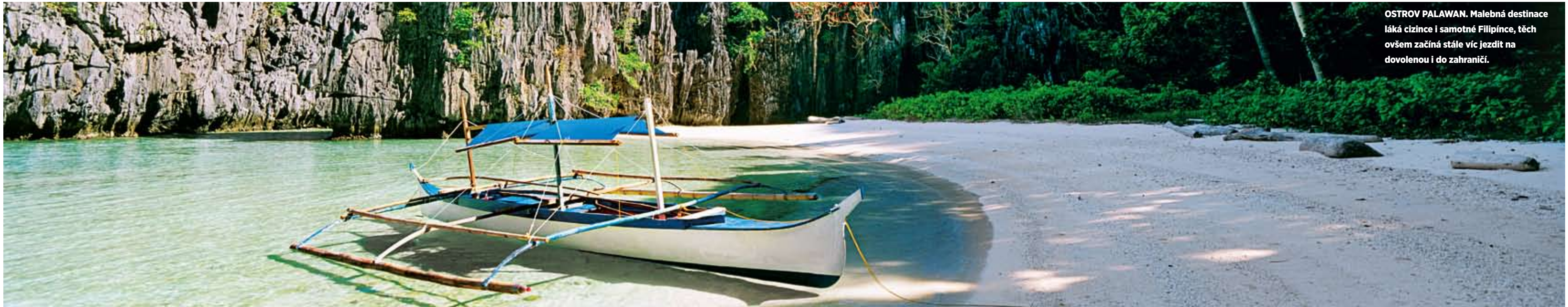
OSTROV PALAWAN. Malebná destinace láká cizince i samotné Filipínce, těch ovšem začíná stále víc jezdit na dovolenou i do zahraničí.