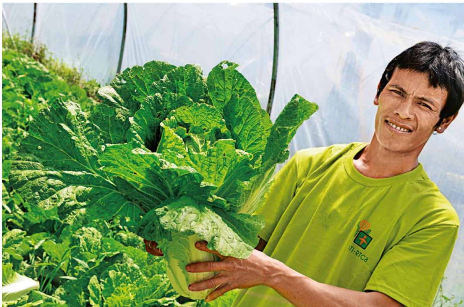
PRO VESNÍČANY. Z malého rozvojového projektu byly zaplacený i fóliovníky pro zemědělské družstvo ve vesnici Cabingtan.

spolupráci s izraelskou organizací IsraAID. Pomoc postavila zpět na nohy místní zemědělce a vytvořila regionální centrum pěstování zeleniny. Program zavedl nové plodiny, vyškolen zemědělce v jejich pěstování a vybudoval zavlažovací systémy. Expert realizující organizace proškolen místní zemědělce v přípravě půdy, ochraně plodin, plánování úrody a jejím využití po sklizni. Český příspěvek je vedle zemědělců a obce samotné oceňován i velvyslanectvím Izraele.