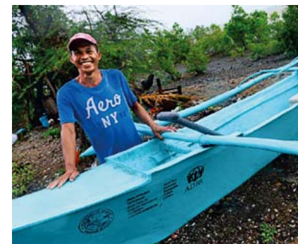
PRO RYBÁŘE. Společnost ADRA jim nahradila lodě, o které přišli při bouři.

Druhý loňský malý projekt podpořený českým velvyslanectvím v Manile spočíval v pomoci vybrané zemědělské společnosti v oblasti poškozené tajfunem Haiyan. Šlo o dodání fóliovníků a stavbu systému zavlažování a ochrany rostlin ve