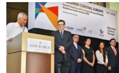
DO STŘEDNÍ EVROPY. Její turistický potenciál představili Filipíncům zástupci Česka a dalších zemí loni v Manile.

Jak se stomilionová země jihovýchodní Asie pomalu ekonomicky rozvíjí, na významu nabývá i turismus. Odhaduje se, že tři miliony