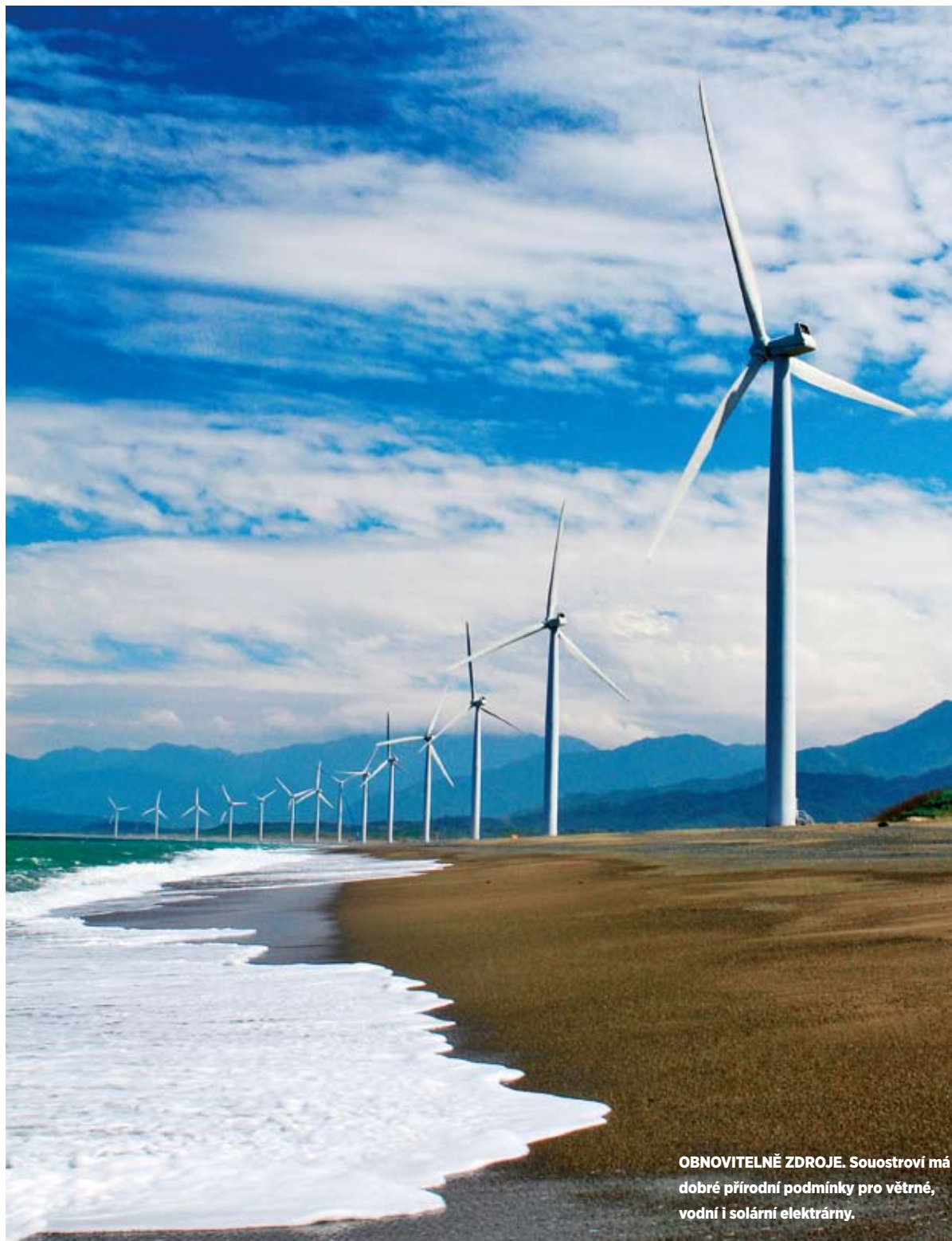
OBNOVITELNÉ ZDROJE. Souostroví má dobré přírodní podmínky pro větrné, vodní i solární elektrárny.

FILIPÍNY JSOU ZASLÍBENY HYDROENERGETICE. ČESKÉ FIRMY TAM OPAKOVANĚ DODALY STROJE PRO VODNÍ ELEKTRÁRNY. PŘÍRODNÍ PODMÍNKY JSOU IDEÁLNÍ. NA OBNOVITELNÉ ZDROJE ENERGIE NAVÍC MOHOU INVESTOŘI ZÍSKAT POBÍDKY V PODOBĚ DAŇOVÝCH PRÁZDIN NEBO CELNÍCH ÚLEV. K DISPOZICI JSOU TAKÉ EVROPSKÉ PROJEKTY NA PODPORU OBCHODU.