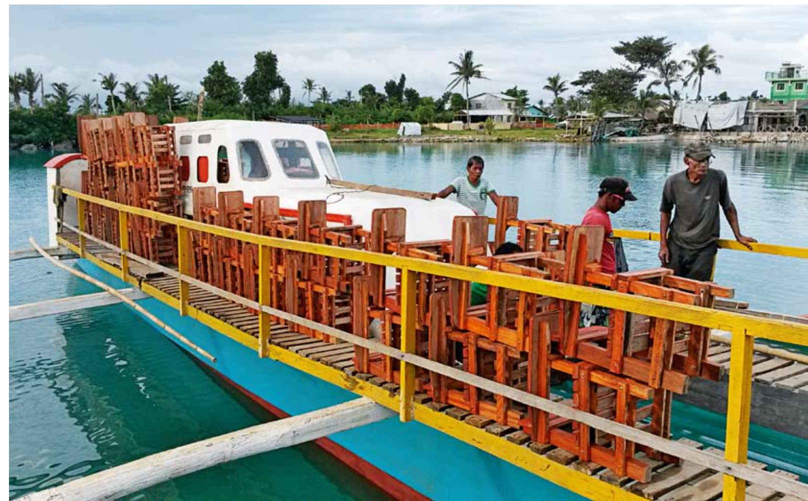
PRO STUDENTY. Česko zafinancovalo u místního truhláře výrobu školních židlí tradičním způsobem.

Organizace Charita ČR dokázala už krátce po tajfunu dopravit na ostrov Samar jídlo, vodu a zajistit základní přístřeší pro postižené. Následně se věnovala obnově škol a zejména podpoře zemědělství, včetně nízkonákladového pěstování rýže, alternativních plodin a používání přírodních hnojiv. Od loňského ledna zastupuje tým Charity ČR na ostrově Samar Helena Kotková. „Výsledky Charity na Samar dokazují, jak může