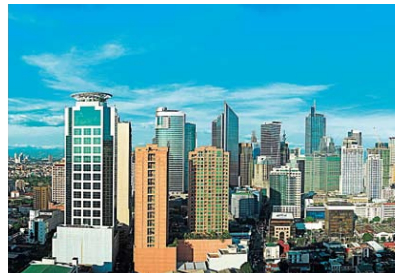
MODERNÍ MANILA. Epicentrem nákupů i byznysu a pýchou Filipínců je čtvrť Makati.

Na Filipínách jste se rozhodl zvolit podobnou strategii, jakou jste použil v Jižní Koreji. Tedy propojit obchodní pronikání s propagací české kultury. Funguje to?