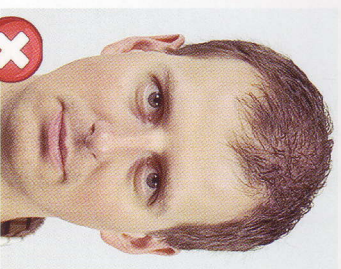
Příliš blízko Too close