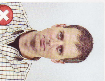
Příliš vzadu Too far away