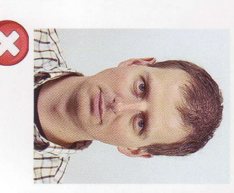
Příliš malá Too small