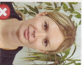
Rušivé pozadí Busy background

Je důležité se vyhnout použití extrémně silných rámečků. / Avoid heavy frames.