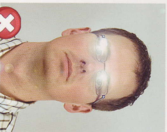
Odlesky od skel brýlí Flash reflections