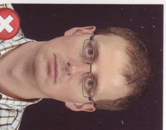
Tmavé pozadí Dark background