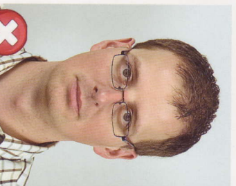
Rámečky překrývají oči Frames covering eyes