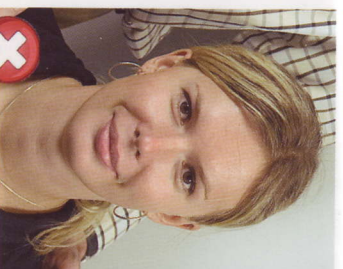
Další osoby Another person