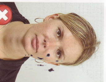
Stopy inkoustu / přehnutí Ink marked / creased