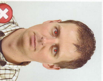
Červené oči Red eyes