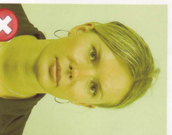
Nepřirozené barvy pokožky Unnatural skinones