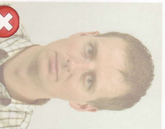
Vybledlý tisk Washed out colour