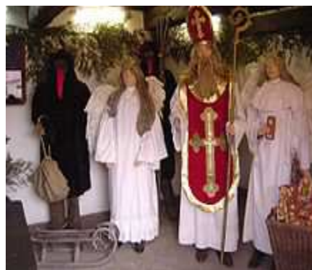
Figuríny Mikuláše, andělů a čertů ve skanzenu v Přerově nad Labem