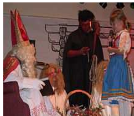
Mikuláš slovenských krajanů v Ottawě v Kanadě (7. prosince 2003)

Jde o jednu z nejstarších legend o sv. Mikulášovi, která se dochovala ve vícero podobách. Podle nejextrémnější verze zchudlý šlechtic poslal své tři dcery do veřejného domu, aby si vydělaly na věno. Mikuláš jim podle legendy hodil oknem po jednom sáček se zlaťáky, takže mohly ukončit svou činnost a vdát se. Umírněnější a poměrně rozšířenější verze podávají celou záležitost tak, že zchudlá rodina uvízla v dluhách a vše směřovalo k tomu, že otec skončí ve vězení pro dlužníky a dcery budou prodány a odvedeny do veřejných domů (resp. tam bez prostředků a věna nakonec stejně skončí). K čemuž však nedošlo díky zásahu sv. Mikuláše, v jehož popisu se obě verze shodují. Rodina tak unikla z dluhů a zbylo i na věno. Vzhledem k této legendě (a její „extrémní“ variantě) je světec též označován jako