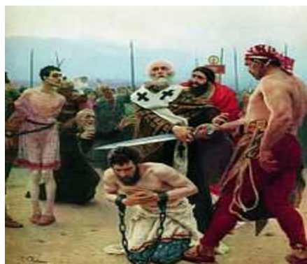
Sv. Mikuláš zastavuje popravu podle Repina.

V celé Evropě nacházíme často cykly se scénami z Mikulášova života – např. v německé Kostnici z 15. století nebo v kostele Panny Marie v Gdaňsku. Po světě jsou rozestry desetitisíce kostelů zasvěcených svatému Mikuláši, mimo jiné např. Basilica di San Nicola v Bari, kde jsou uchovávány jeho ostatky, ze kterých už po několik staletí vytéká tekutina - myro. V Česku je to například katedrála svatého Mikuláše v Českých Budějovicích, v Praze stojí kostel na Staroměstském náměstí, na Malé Straně a barokní ve Vršovicích. V Brně stál Kostel svatého Mikuláše na náměstí Svobody.