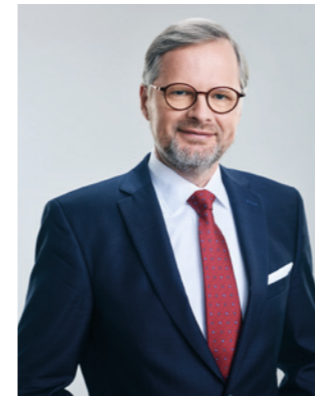
Petr Fiala předseda vlády České republiky