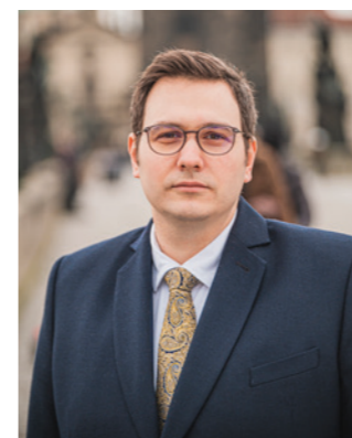
Jan Lipavský ministr zahraničních věcí České republiky